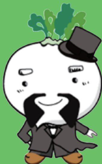
鹿児島市食育推進キャラクター「でこん丸」

「鹿児島の食」どのくらい知っていますか？鹿児島にはおいしい食材ばかり！ 「鹿児島の食」を食べて、みんなで鹿児島を盛り上げよう！