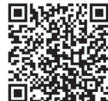
◀水道管の凍結防止 （水道局ホームページ）

A. メーターボックス内の元栓（止水栓）を閉め、下記の 水道局指定給水装置工事業者 に修繕をご依頼ください。