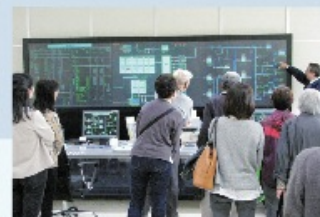
水道モニター会議の様子 (河頭浄水場施設見学)