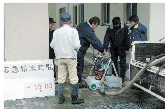
応急給水の様子（花尾小学校）