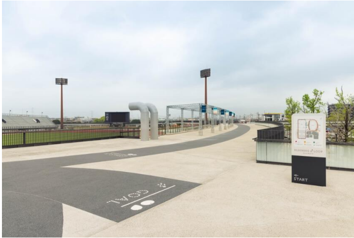
▲ランニンググループ

SAGAサンライズパーク内にジョギングや散歩などを楽しめる「ランニンググループ」を設置。健康づくりやトレーニングに励むことができる。