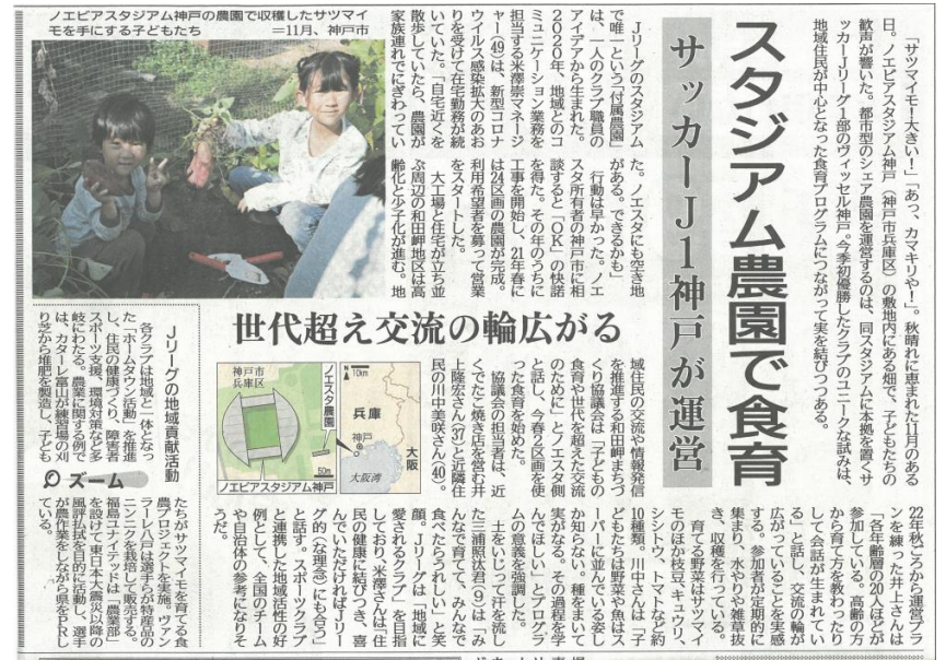
▲ 令和5年12月5日 南日本新聞

クラブがスタジアム敷地内に畑を整備し、地域住民(まちづくり協議会)が中心となり、食育プログラムを実施