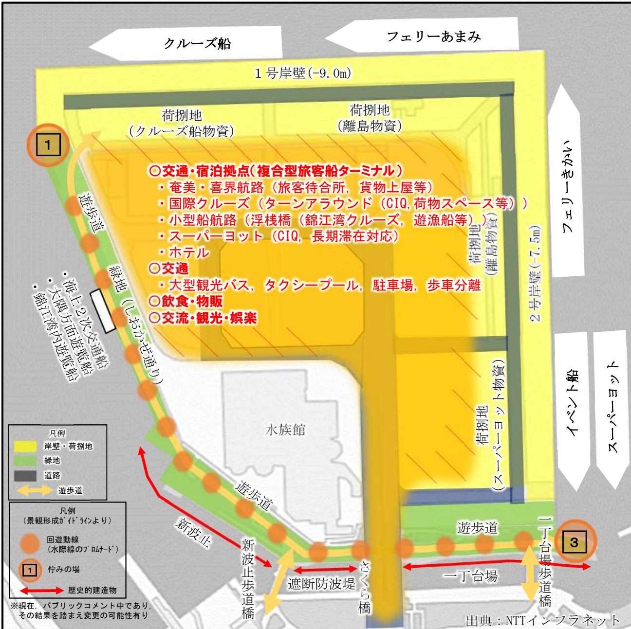
複合型旅客船ターミナル (イメージ)