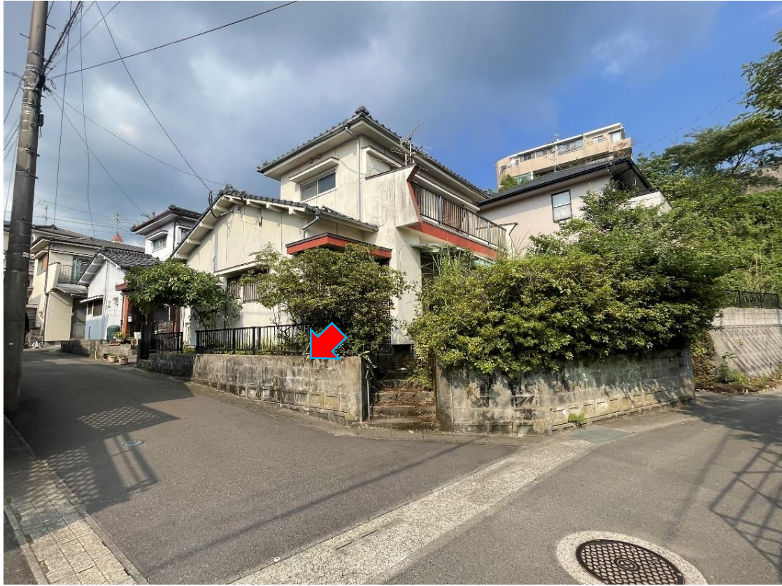
財産2（公衆用道路）を南西方から撮影