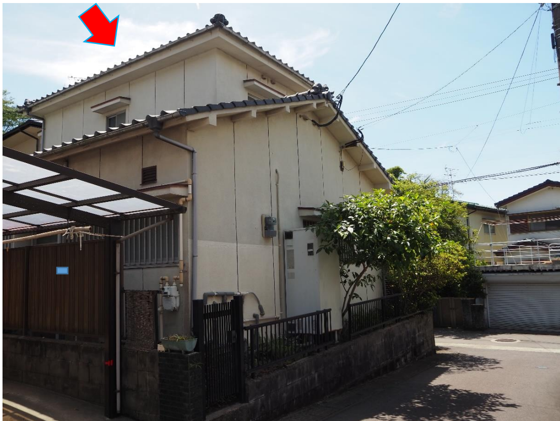
北西方からの撮影