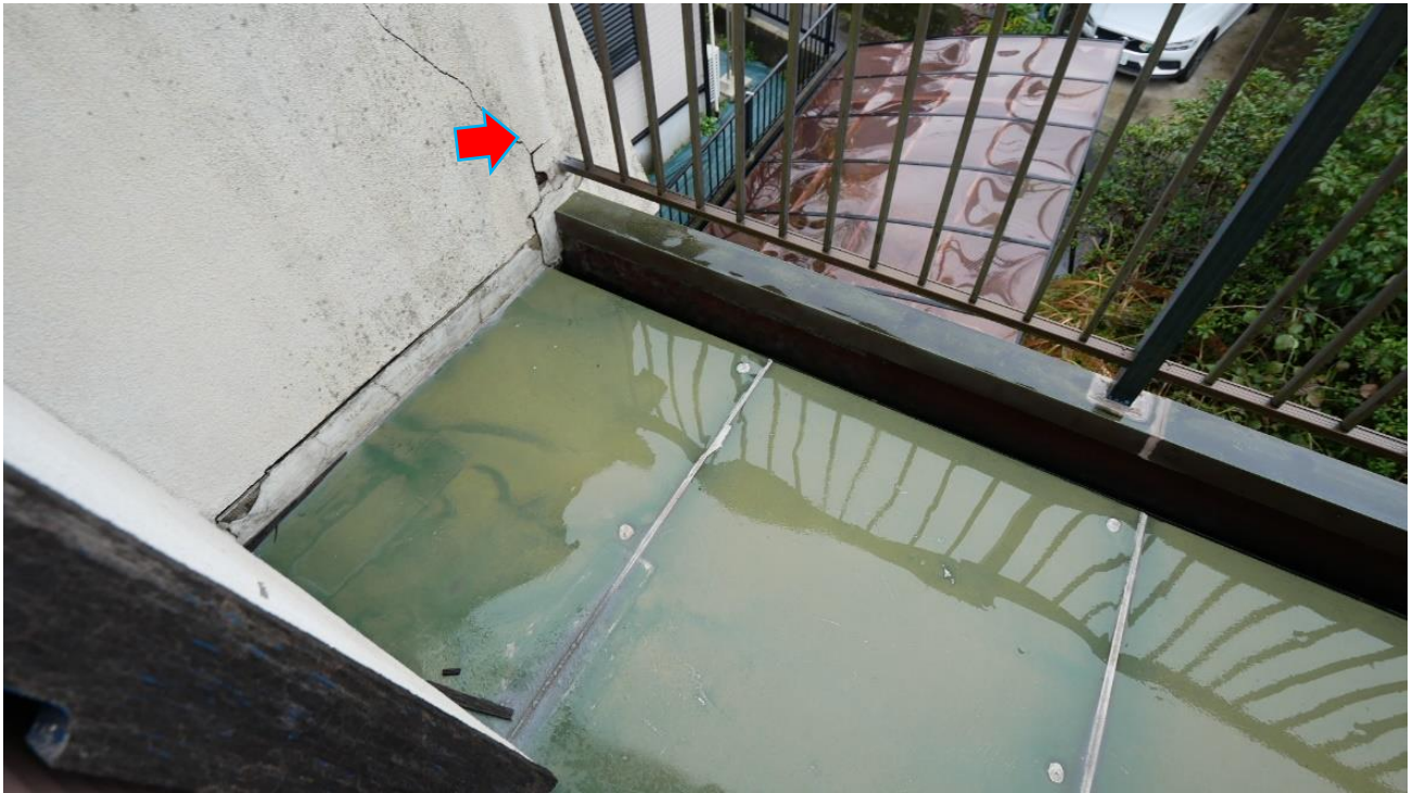
ひび等あり（2階バルコ）