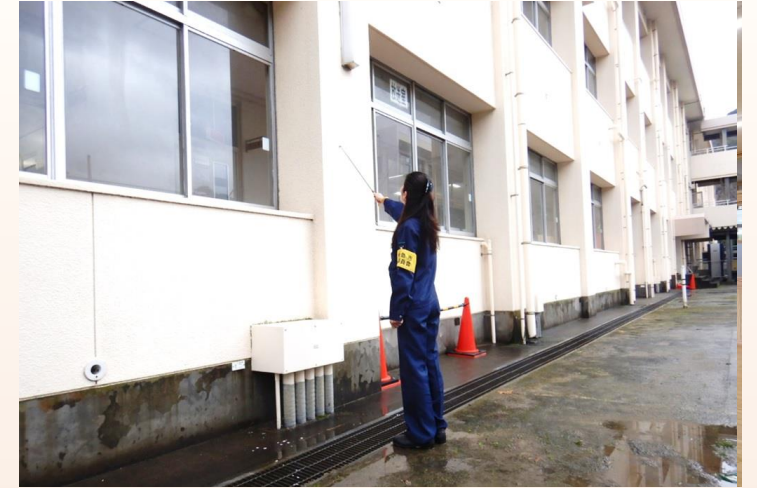
外壁安全確認（打診調査）

市立学校全121校の全てにおいて、児童生徒が安心して学べる環境の保全・充実が求められる中、限られた財源の中で必要な整備や修繕を行う必要があります。施設数が多く内容也多岐に渡り、検討することも多いですが、事故を未然に防ぎ、児童生徒の安全な教育環境を確保するために、重要な業務です。