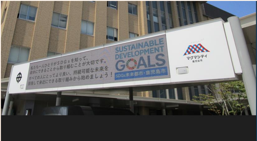
本庁舎電光掲示板

管財課は様々な職種の職員が在籍しており、それぞれの知見を活かしながら互いに切磋琢磨できる職場です。また、市役所の仕事を通して様々な経験を積むことができます。ぜひ、一緒に働きましょう！