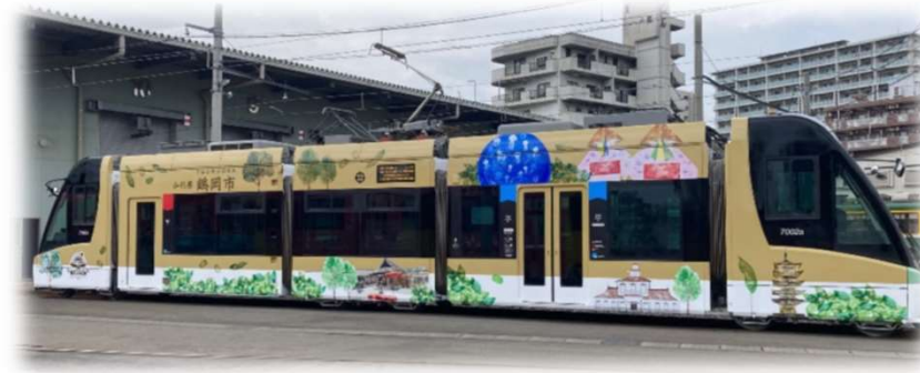
鹿児島市電・鶴岡号