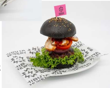
BLACK ▶ HAMBURGER