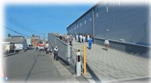
昨年の津波避難訓練の様子