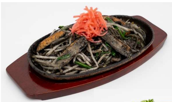
▲鹿児島さつま 揚げのイカ墨 焼きそば