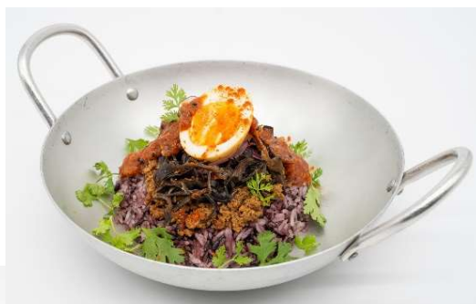
◀黒豚と黒米の 薬膳キーマ カレー