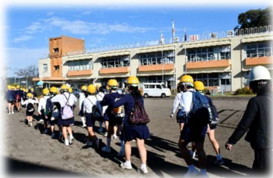
昨年の訓練の様子