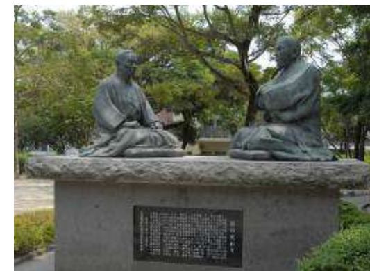
西郷公園「徳の交わり」銅像