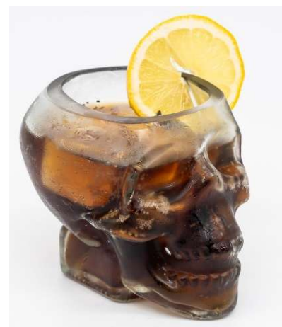
▲オリジナルグラス の一つ「スカル」