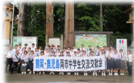
鶴岡市への使節団派遣 (令和6年7月23日～25日)