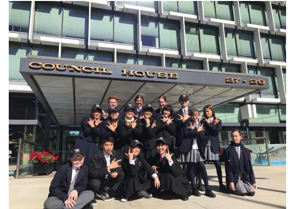
令和元年度のパース市訪問団