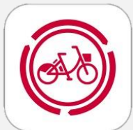
アプリの アイコン