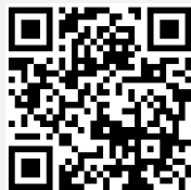
新かごりん ホームページ