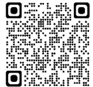
説明動画 (You Tube)