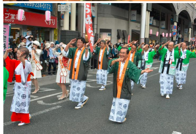
(上) 鹿児島市制 130 周年記念式典 (11 月 2 日)