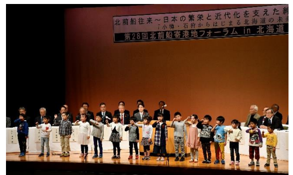
第28回北前船寄港地フォーラム in 北海道小樽・石狩