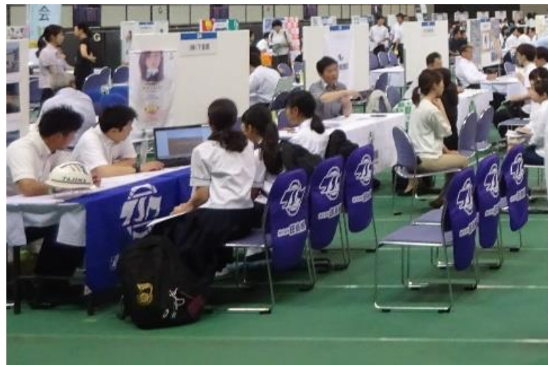
昨年度開催の様子