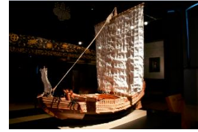
「北前船模型」 尚古集成館蔵

財政事情が苦しかった薩摩藩は、北前船が蝦夷（北海道）などから調達した昆布等を入手し、琉球を経由して中国に輸出することなどして財政を立て直し、明治維新へつなげたとされている。