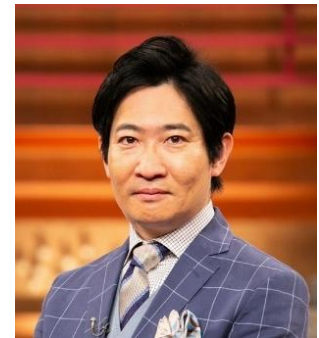
磯田 道史 氏