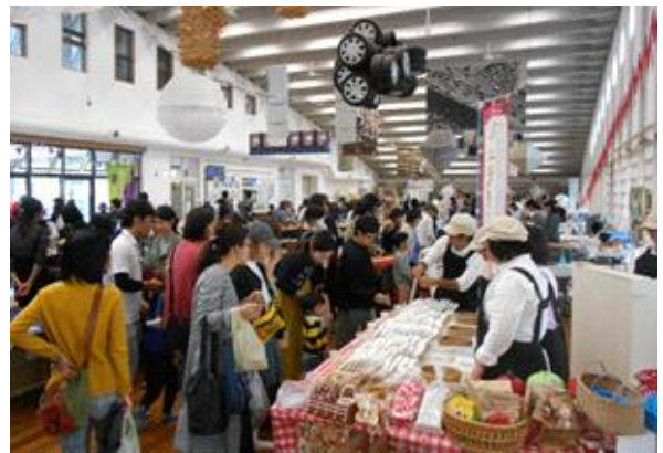
昨年度の城西マルシェの様子