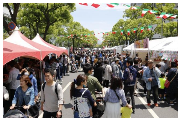
昨年度のナポリ祭の様子