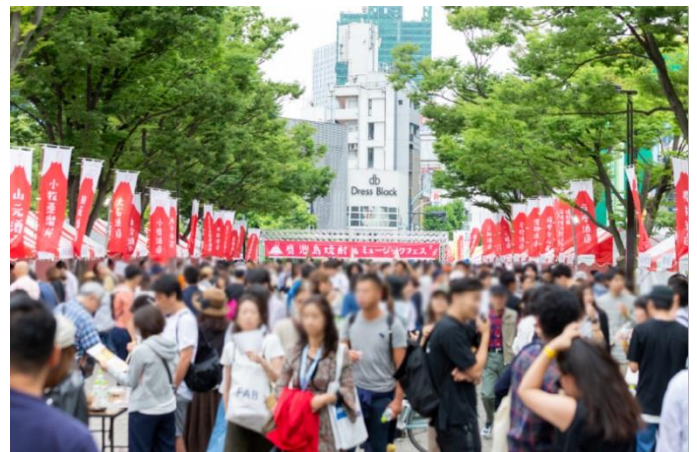
昨年度の鹿児島焼酎&ミュージックフェス