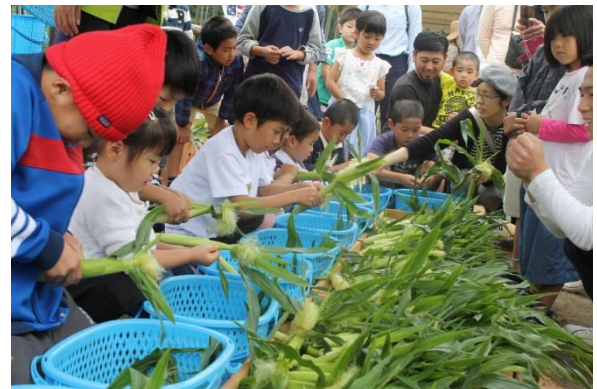
ヤングコーンの皮むき大会