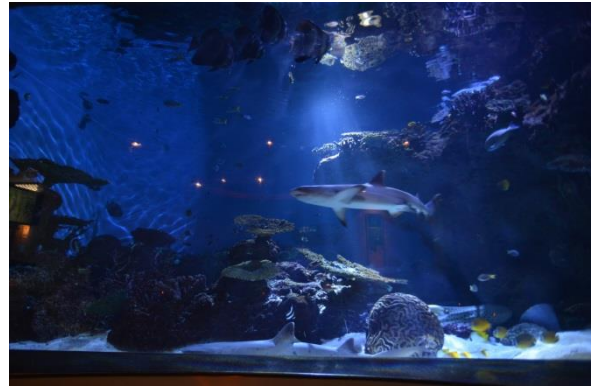
トワイライトアクアリウム