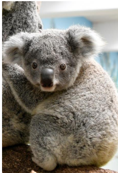
オス H30. 6. 26生 (父親：バンブラ、母親：ココロ)