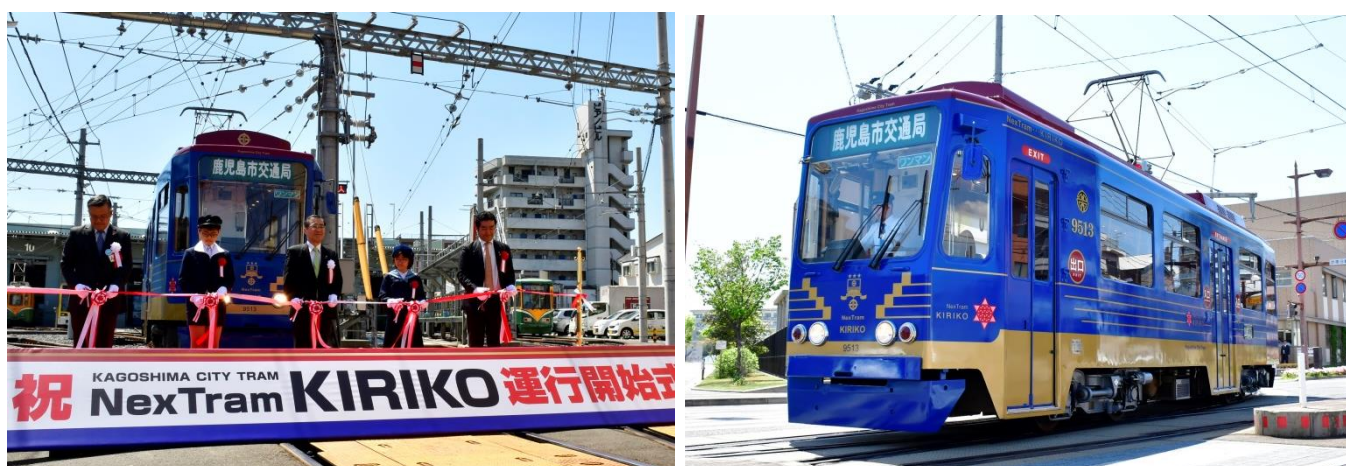
市電「NexTram KIRIKO（ネクストラム キリコ）」 運行開始式（4月18日）