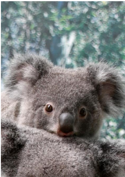
メス H30. 6. 25生 (父親：ブンダ、母親：ユメ)