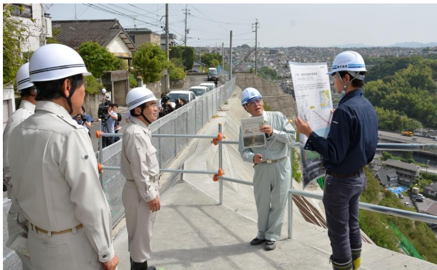
昨年度の防災点検の様子 田上10地区急傾斜地崩壊対策工事（武岡3丁目）