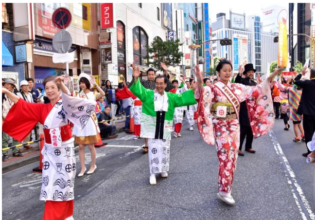
昨年度の渋谷・鹿児島おはら祭