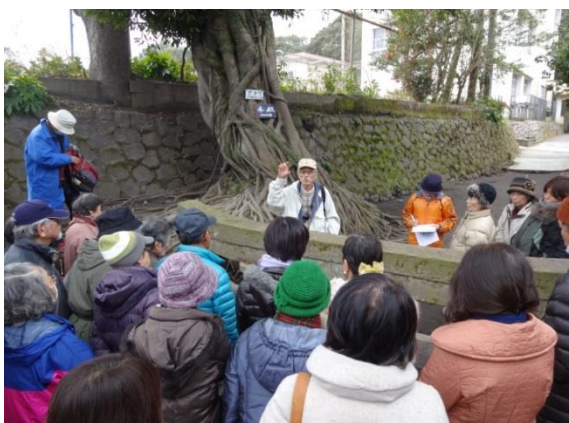
ジオツアーの開催