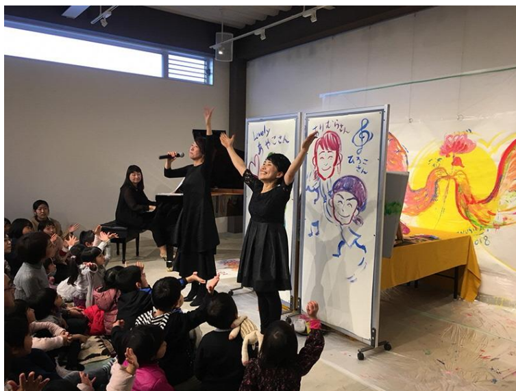
NPO法人 active sounds Sitiera アートムジカコンサート（昨年度）