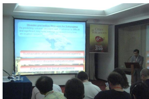
平成22年（2010年）のCoV6（テネリフェ大会）市長発表の様子