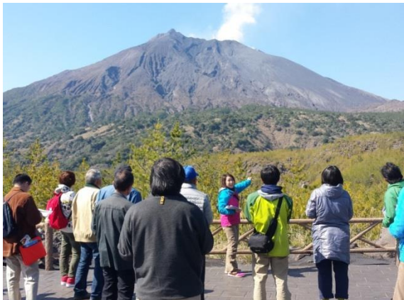
認定ジオガイドの養成