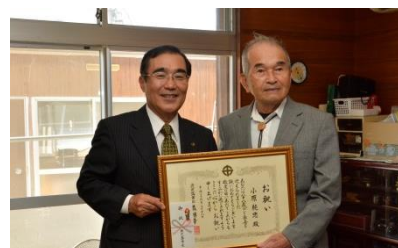
昨年の市長による敬老訪問

永年にわたり社会のために貢献してこられた高齢者に敬意と祝意を表するとともに、更なる長寿を記念して、市職員が民生委員とともに訪問し、お祝い状と敬老祝い金を贈呈する。