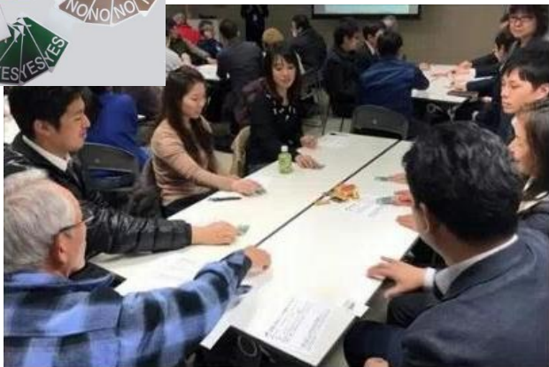
防災カードゲーム「詮議（せんぎ）」の開発・活用