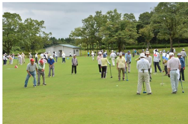
昨年のグラウンド・ゴルフ大会の様子