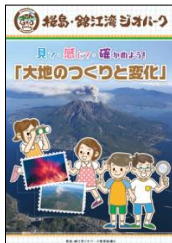
小学生向け副読本の作成・活用