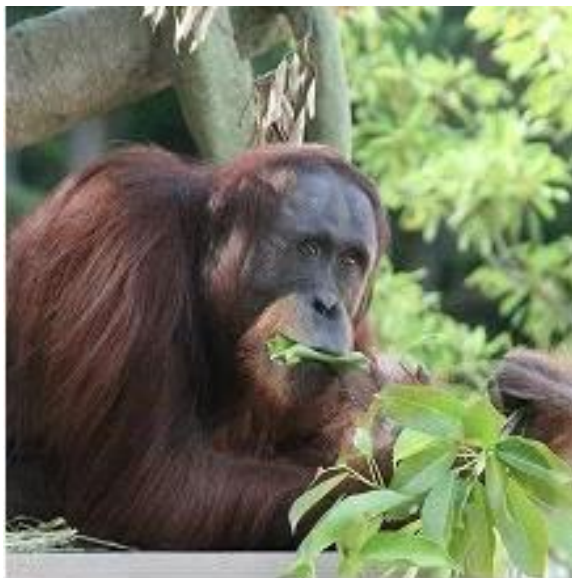
平川動物公園のボルネオオランウータン「ポピー」

■ 問い合わせ 平川動物公園 099-261-2326 観光振興課 099-216-1327