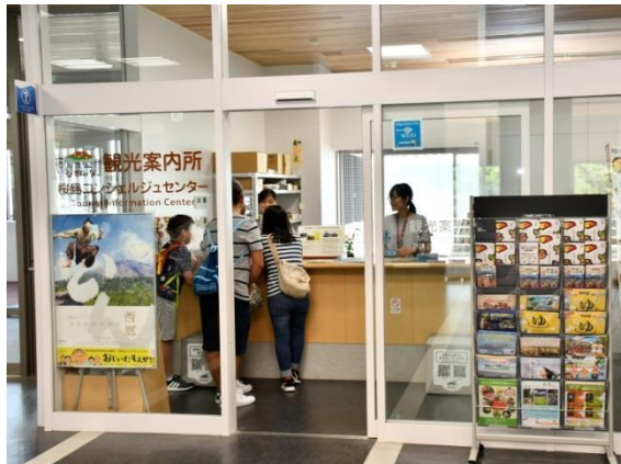
桜島コンシェルジュセンターの 設置・運用