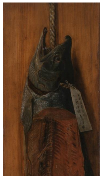
高橋由一『鮭図』（部分） 笠間日動美術館（山岡コレクション）

ヤンマーディーゼル株式会社の創業者・山岡孫吉氏が収集した日本洋画の一大コレクション。現在は笠間日動美術館（茨城県）に寄託されている。