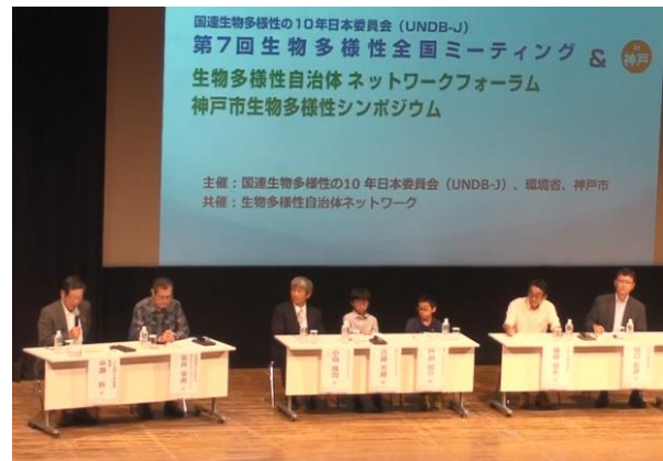
平成29年9月に神戸市で開催された時の様子