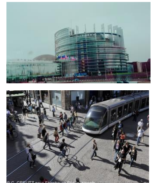
EU本会議場(写真上) 市街地を走るLRT(写真下)