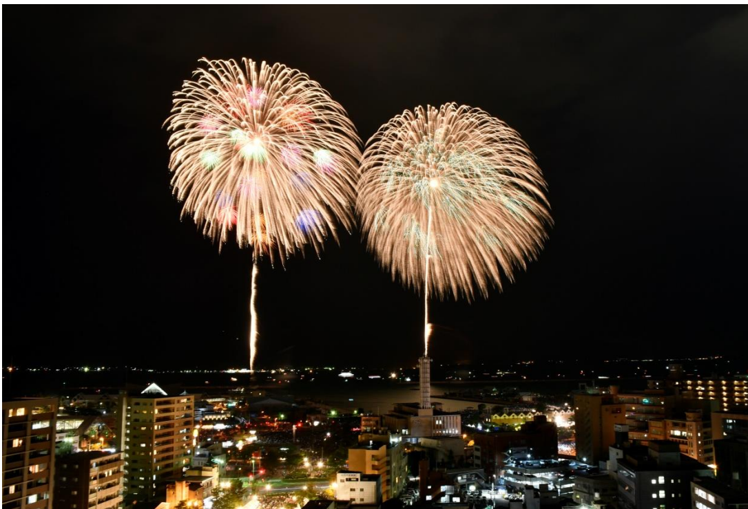
明治維新150周年 第18回かごしま錦江湾サマーナイト大花火大会 二尺玉同時打ち上げ (8月18日)