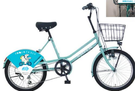
かごりん「COOL CHOICE号」（イメージ）