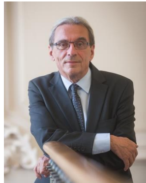
ローラン・リース ストラスブール市長