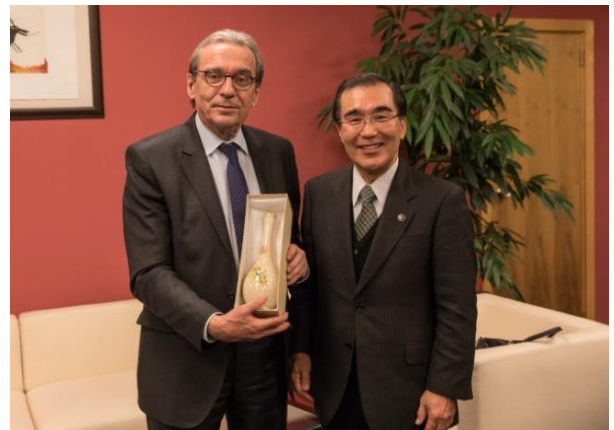
ストラスブール市長(写真左)表敬時の様子(1月)