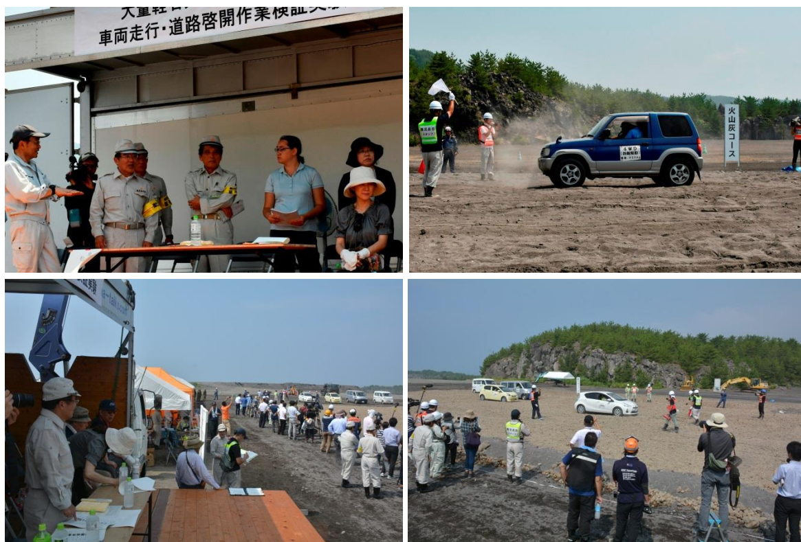
大量軽石火山灰を想定した車両走行実験（7月26日）