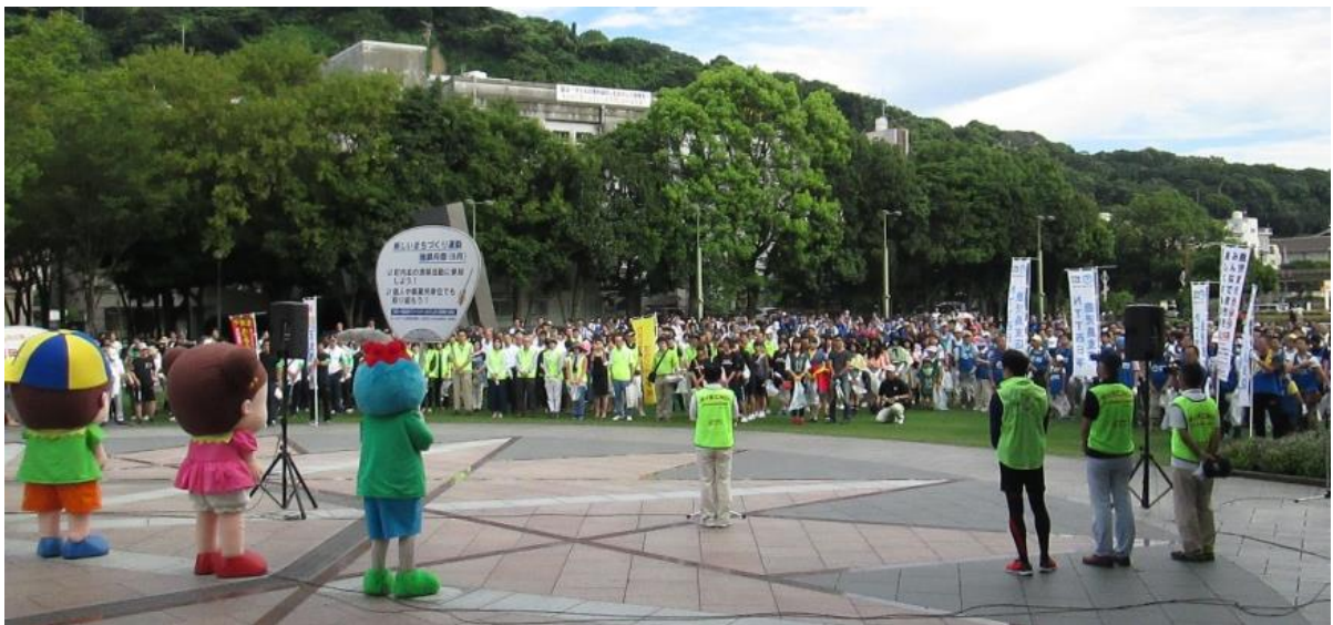
クリーンシティかごしま 開始式