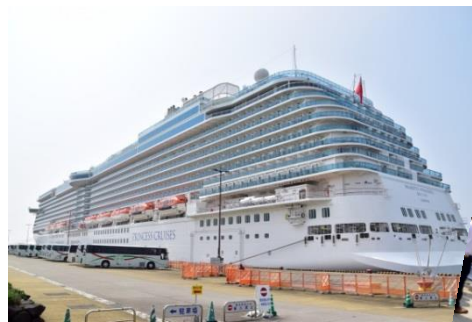
クルーズ船寄港 (29年7月 マジェスティックプリンセス号)