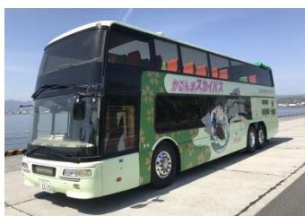
オープンバス「かごんま そら バス」