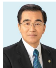
森 博幸 鹿児島市長