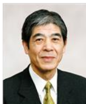
菅谷 昭 松本市長