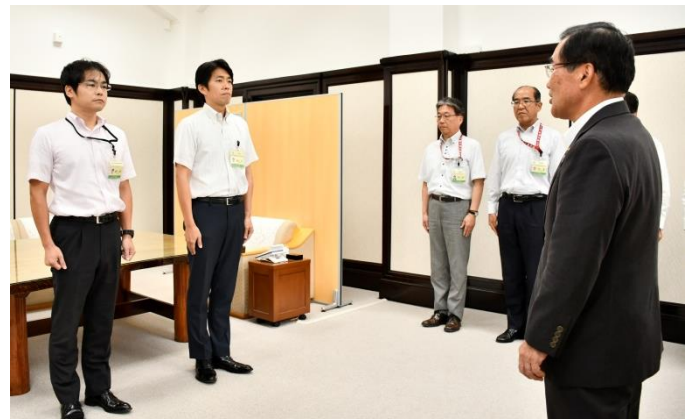
倉敷市への派遣(7月23日～)