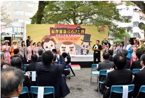
明治維新150周年カウントダウン事業