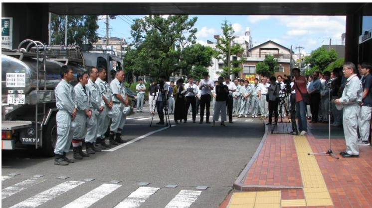
江田島市への応急給水支援(7月9日～25日)