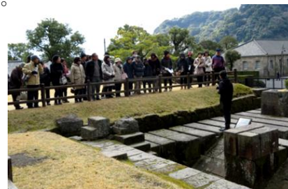
旧集成館反射炉跡（仙巖園内）