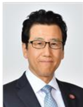
秋元 克広 札幌市長