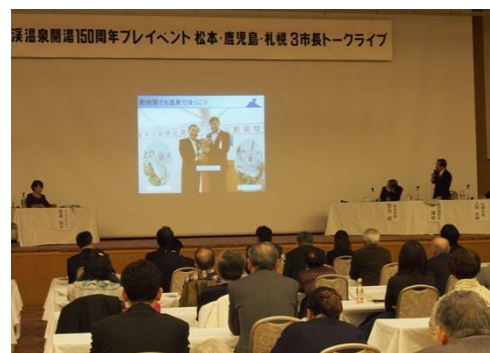
平成27年2月に札幌市で開催された3市長トークライブ