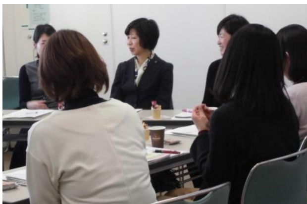
女性活躍アドバイザーと女性職員の意見交換