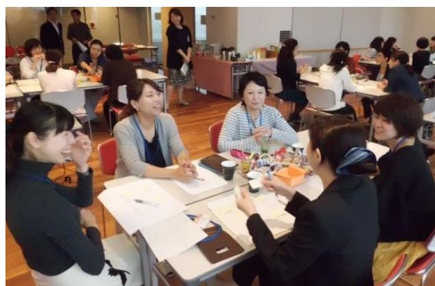
平成29年度の女性活躍推進イベントの様子