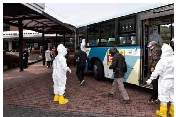
バスによる住民輸送(昨年度訓練)