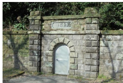
滝之神水源地第二水源

市北東部を流れる稲荷川のほとりにある溪谷の水源地。水神、龍神が祭られ、歴史と季節に彩られる静かで緑豊かな溪谷は、今も清らかな水を豊富に湧き出し続けている。