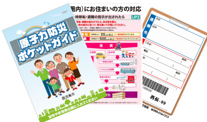
防災ポケットガイド(バーコード付き) 原子力防災時の注意点や、とるべき行動を掲載したもの