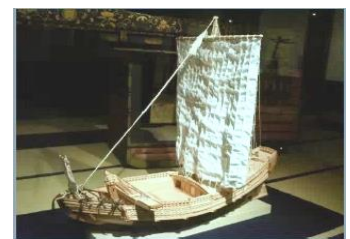
「北前船模型」 尚古集成館蔵