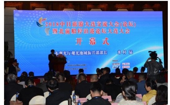
中国・大連市で開催された第23回フォーラムの様子