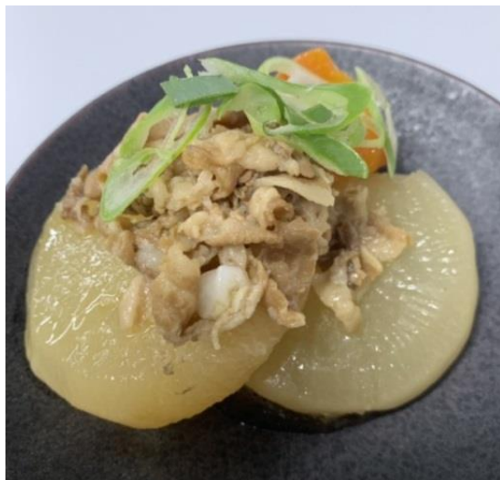
期間限定メニュー かごしま黒豚と桜島大根のふろふき