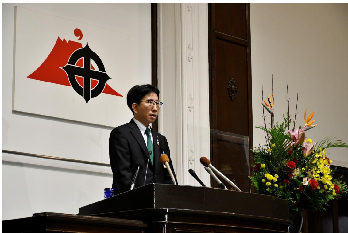
下鶴市長就任挨拶（令和2年12月23日）