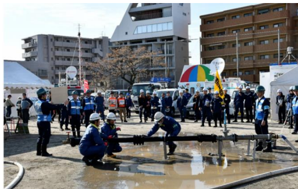
昨年度の桜島火山爆発総合防災訓練（避難所運営・展示訓練）の様子

※詳細については、 1月5日11時から災害対策本部室にて 担当課から説明を行います。