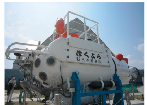
「はくよう」の中に入っちゃおう！