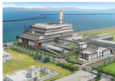
新南部清掃工場 完成予想図