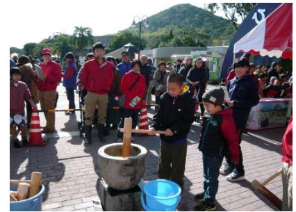
新春親子もちつき大会