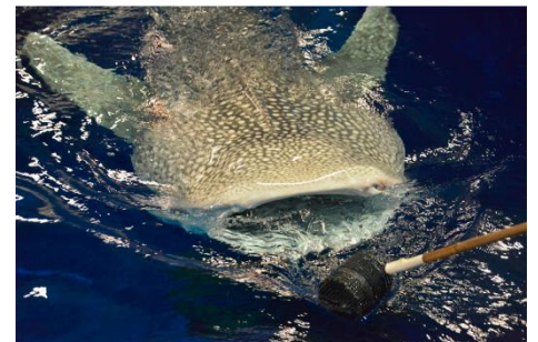
ジンベエザメの食事をまぢかで見よう！