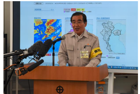
市長緊急記者発表（7月3日）