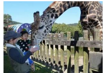
好きな動物にエサをあげよう