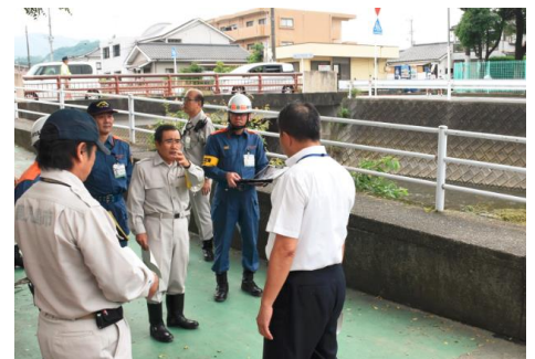
被害現場視察（7月5日）