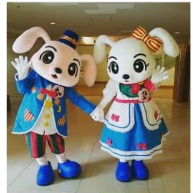
メルくん・ルンちゃん

期 日 1月2日(木)・3日(金) 11時～、13時30分～、 15時～(各回30分程度)