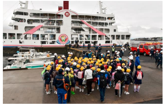
フェリーによる避難訓練