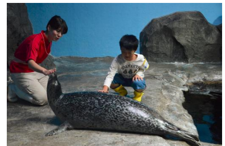
アザラシをまぢかで見よう！