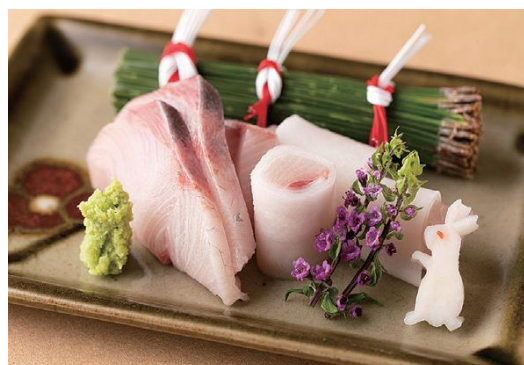
鹿児島産ブリの桜島大根巻 (「九州 力」のメニュー)