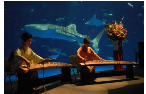
黒潮大水槽をバックに琴の演奏

期 日 1月7日 (火) 12時10分～12時35分 定 員 抽選で10組 (1組6名まで) 受 付 11時30分～12時 1階エントランスホール