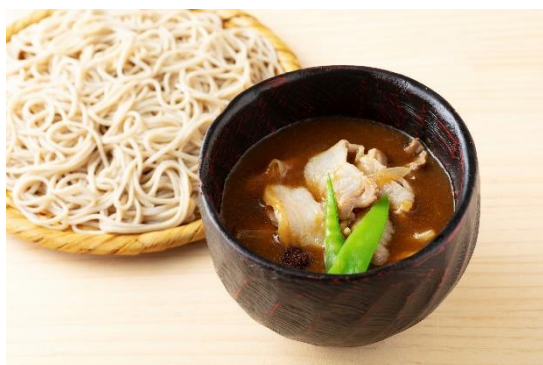
鶴岡産のそば粉を使用した 黒豚つけカレーせいろ (「日本ばし やぶ久」のメニュー)