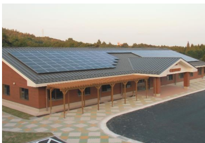
太陽光発電システム （観光農業公園）

「第三次環境基本計画」及び「第二次地球温暖化対策アクションプラン」等（令和3年度策定予定）に、2050年二酸化炭素排出実質ゼロを見据えた具体的施策を盛り込み、体系的に事業の展開を図っていく。