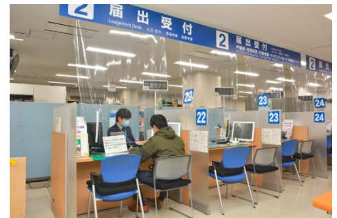
窓口の飛沫感染防止シート（市民課）