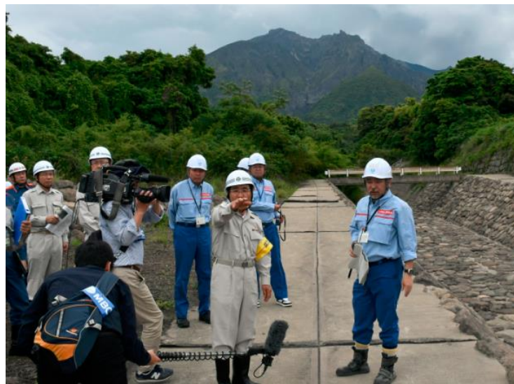
市長の防災点検の様子