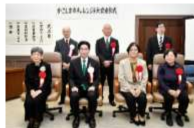
令和3年度の表彰式