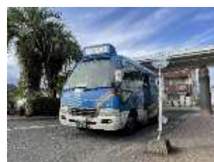
かごしま市コミュニティバス 「あいばす」