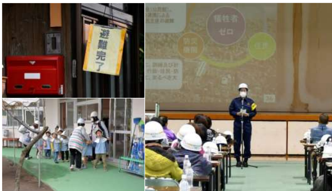
桜島火山爆発総合防災訓練（11月19日）