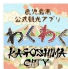
アプリのアイコン