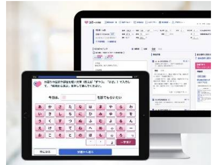
右上：院内表示画面 左下：問診入力画面