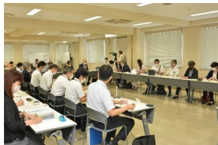
前回(7月12日)の同会議