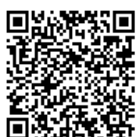
アプリのダウンロード