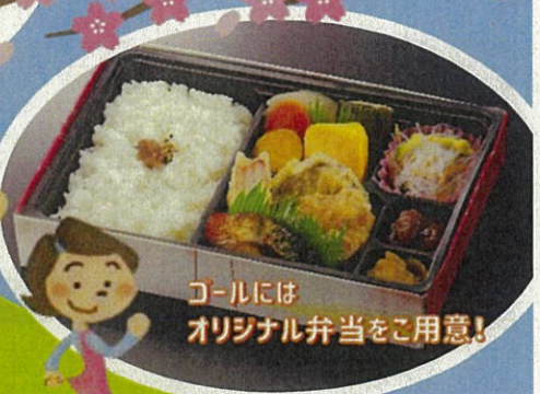
ゴールには オリジナル弁当をご用意!