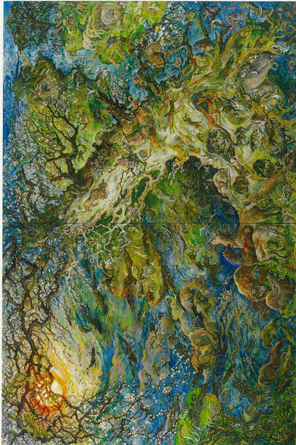
「ことば響くあたり」2019、333.3×497.0cm