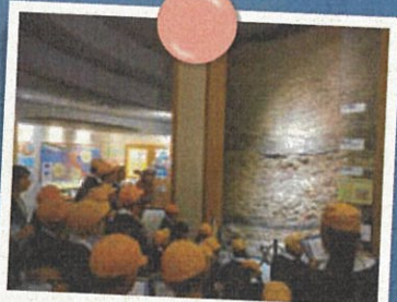
桜島ビジターセンター