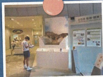
桜島国際火山砂防センター