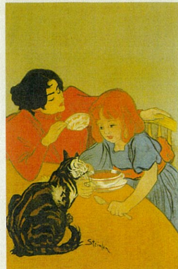
テオフィル＝アレクサンドル・スタンラン 《猫と一緒に母と子》1885年