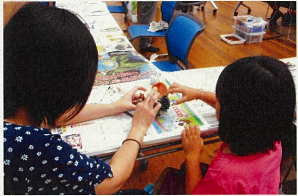
昨年の「甲突川リバーフェスティバル」