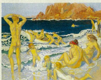
モーリス・ドニ《ペロスはギリックの海水浴場》1924年