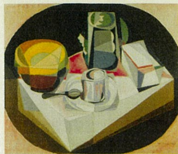
マリア・ブランシャール《静物》1917年