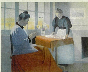
アール・ロージェ 《窓辺》1899年