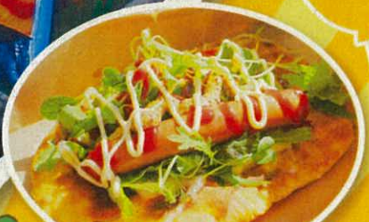
チーズインハンダッグ