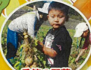
季節の野菜 収穫体験