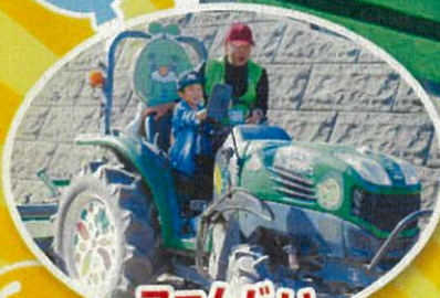
ファームじい トラクターに乗ろう!