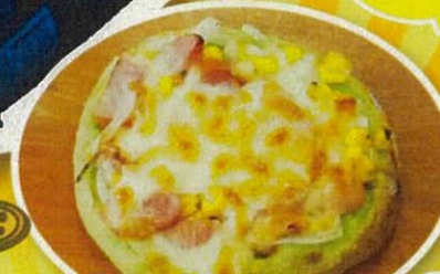
グラタンミニピザ