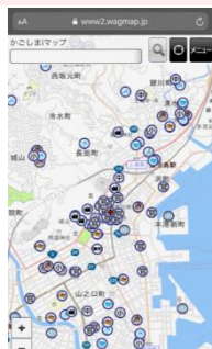
「かごしまiマップ」から 防災マップ画面へ