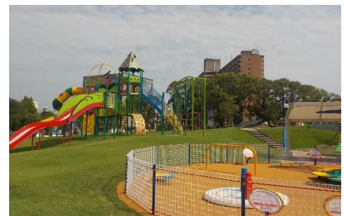
すくすく広場、みんなの原っぱ

日時 10月23日（金）10時30分～ ※式典終了後、供用開始 出席者 市長、市議会議員、地元関係者、 工事関係者 など