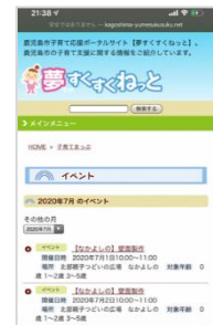
「夢すくすくネット」 ホームページへ