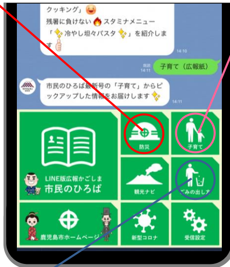
各分野の情報への選択画面