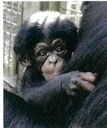
③ オス R2. 2. 15生 (父親：ラルゴ、母親：モモ)