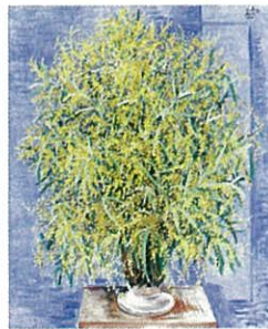
《ミモザの花束》1946年 パリ市立近代美術館