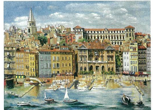
《マルセイユ》1940年 プティ・パル美術館/近代美術財団、ジュネーブ