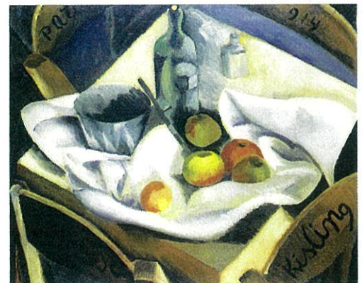
《果物のある静物》1914年 プティ・パル美術館/近代美術財団、ジュネーブ