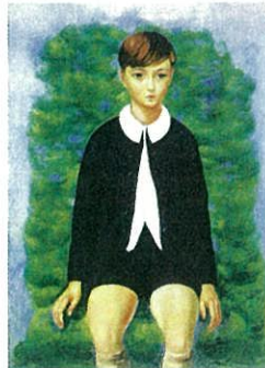
《ル・ベック氏の息子》1926年 熊本県立美術館