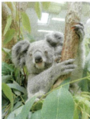
① メス R1. 6. 22生 (父親：バンブラ、母親：ユメ)