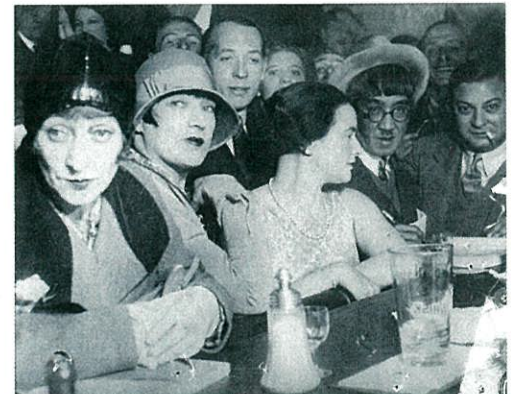
1920年 カフェ・ドラ・ロトンド (右端がキスリング、その左隣は藤田嗣治)

〒892-0853 鹿児島市城山町4-36 Tel.099-224-3400 http://www.city.kagoshima.lg.jp/artmuseum/