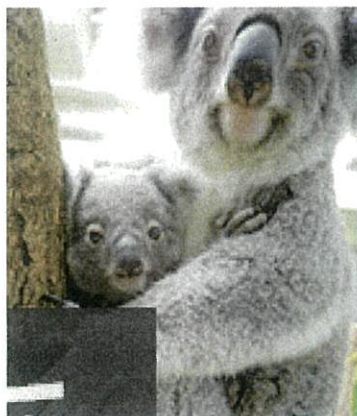
② メス R1. 10. 17生 (父親：バンブラ、母親：ジェイン)