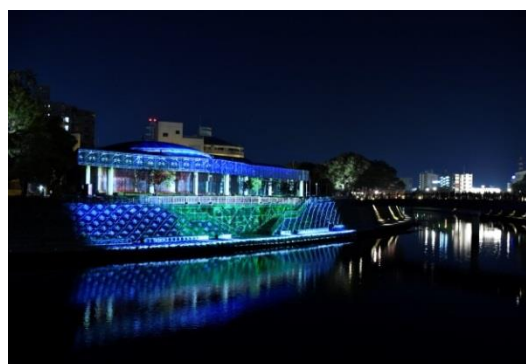
薩摩維新ふるさと博