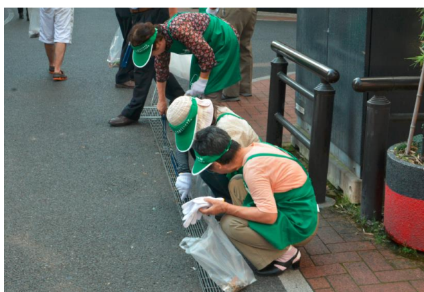
天文館クリーン作戦