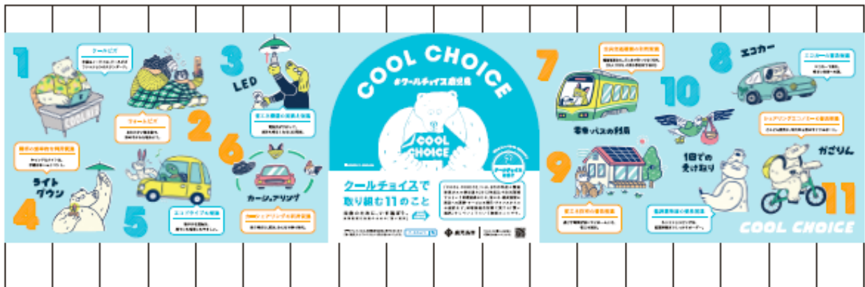
仮囲い広告デザイン(案)