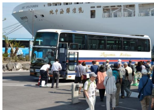
クルーズ船寄港 (MSCスプレンドィダ)

※詳細については、 記者会見終了後、市政記者クラブにて担当課から説明を行います。