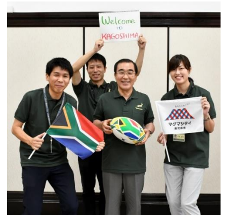
市長とスポーツ課職員