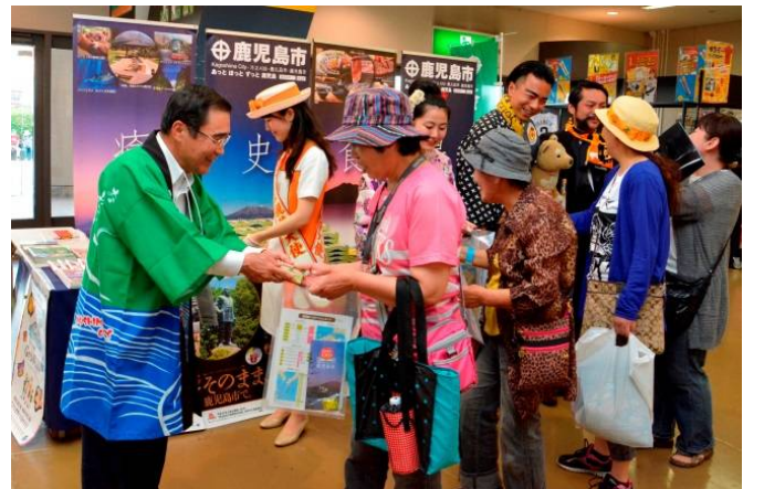
昨年の「鹿児島デー」の様子