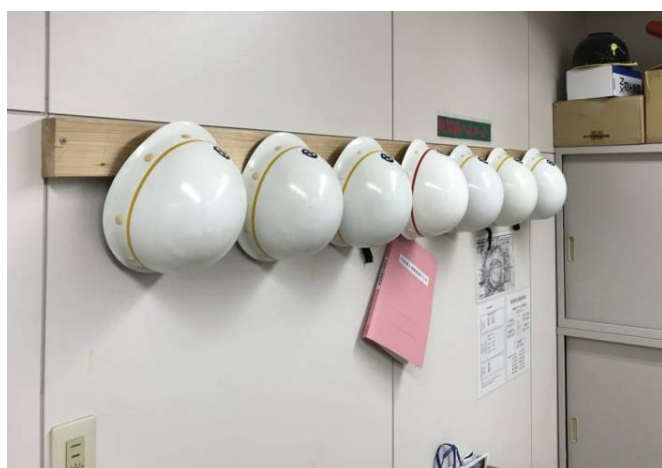
道の駅さくらじま 火の島めぐみ館