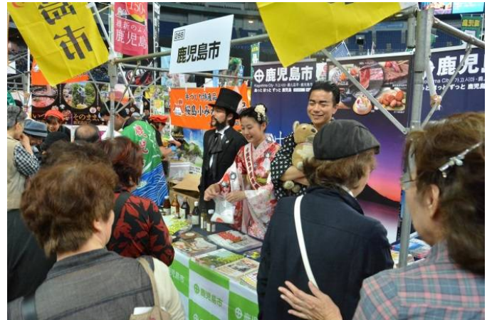
第13回関西かごしまファンデー