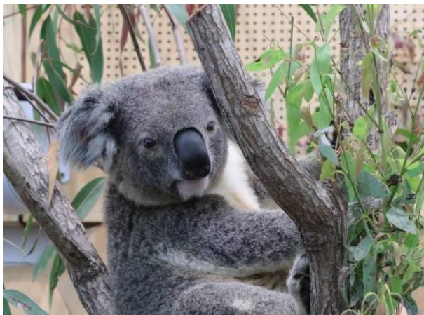
バンブラ (オス 5歳)

バンブラとジェインが加わり、平川動物公園のコアラ飼育数は国内最多(10頭)となります！