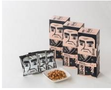
南国珍々豆プレミアム