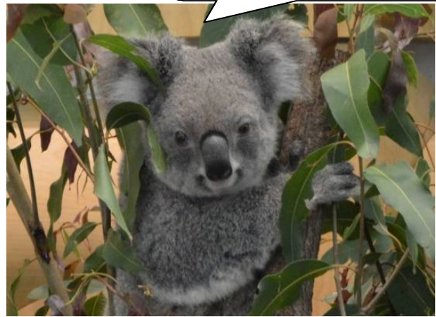
ジェイン (メス 4歳)