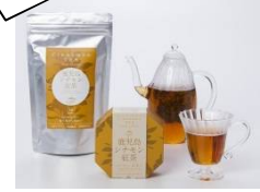
鹿児島シナモン紅茶