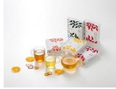
KEIKO Plus ナチュラル フレーバー ティーシリーズ (株)下堂園提供)