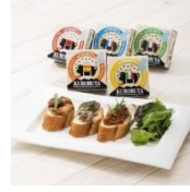
黒豚缶詰グルメカップ シリーズ