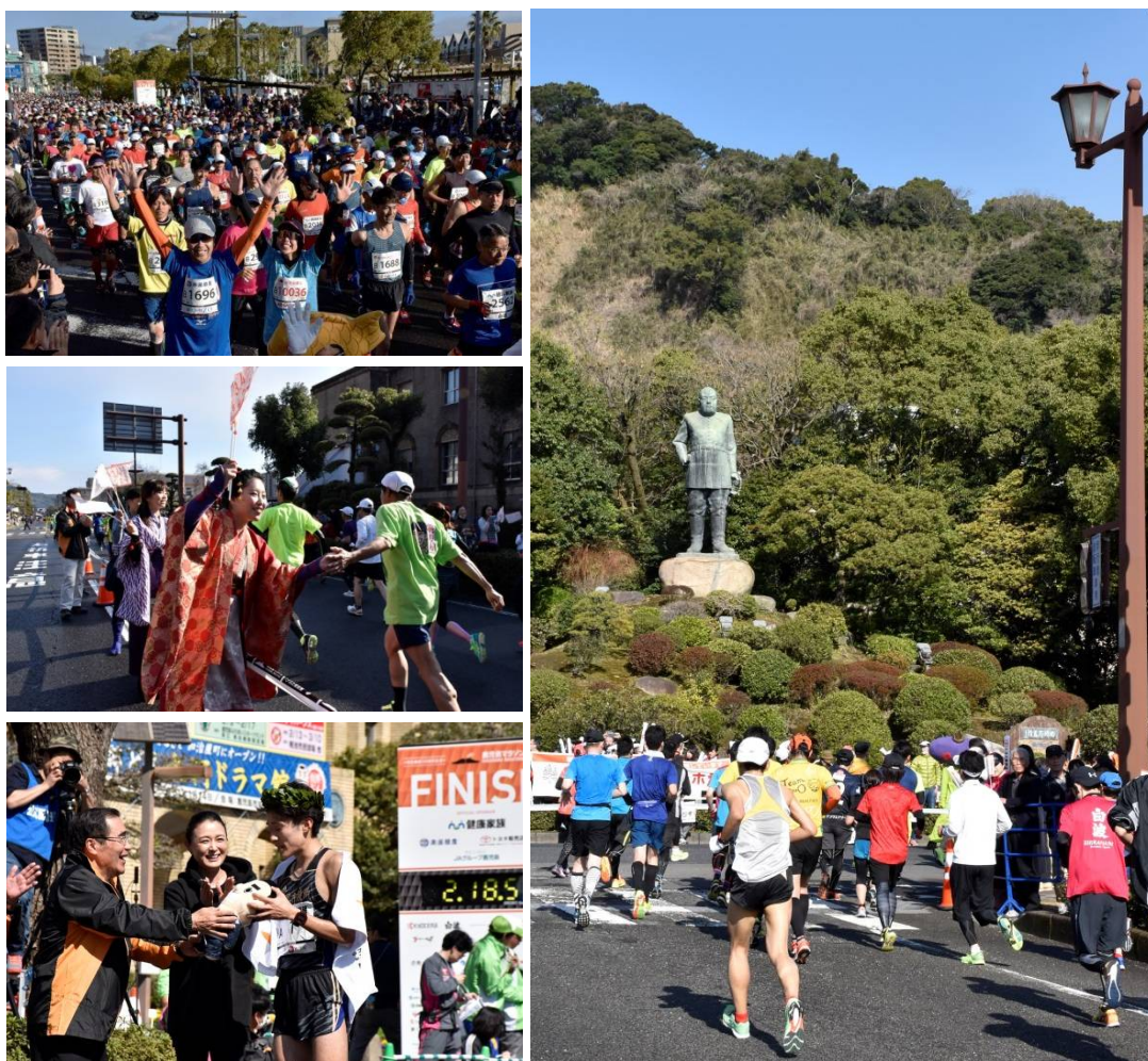
明治維新150周年記念 鹿児島マラソン2018（3月4日）