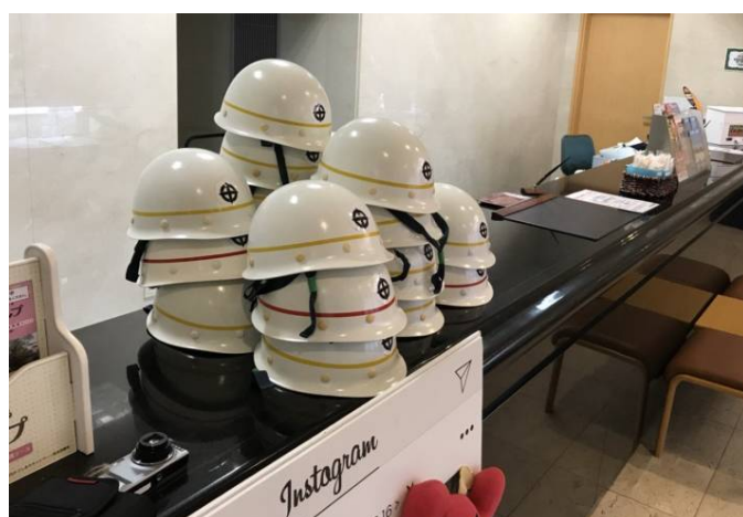
国民宿舎レインボー桜島