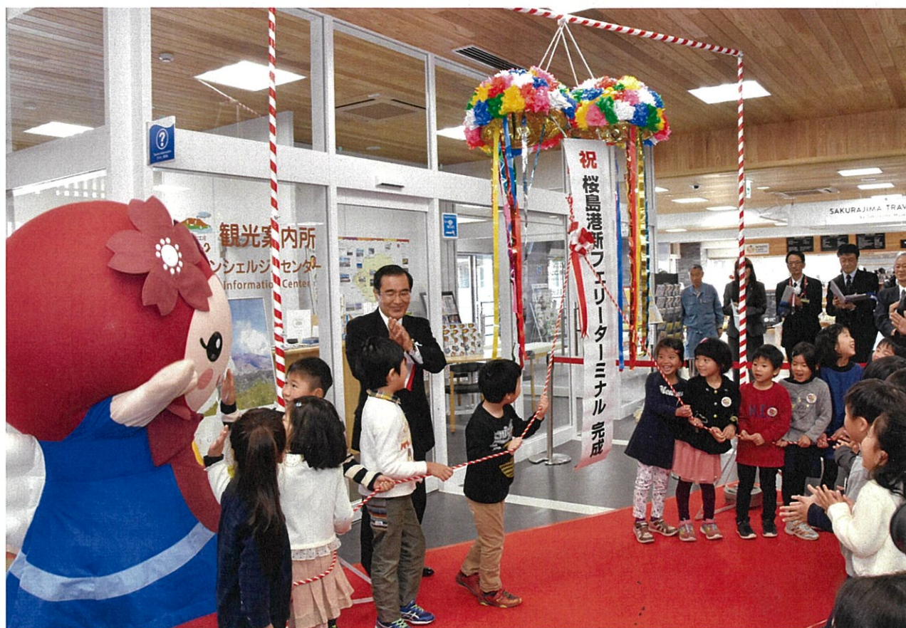
桜島港新フェリーターミナル 供用開始記念セレモニー（3月23日）