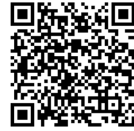
専用ホームページ