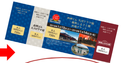
共通チケットなら 大人 720 円