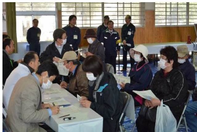
健康相談の実施 (平成28年度原子力総合防災訓練)