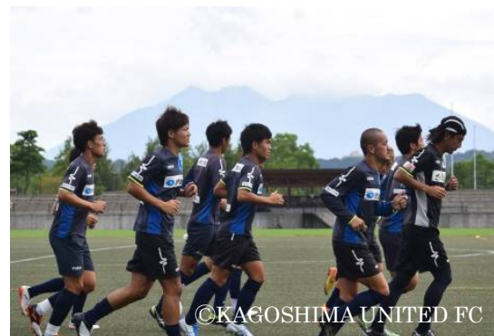
鹿児島ユナイテッドFC