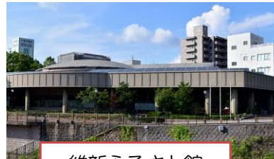
維新ふるさと館 通常 大人 300 円