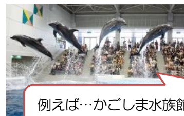
例えば…かごしま水族館が 大人 1,500 円→1,200 円に割引

②観光施設など（A）の入場券や、公共交通機関の一日乗車券など（B）を、大河ドラマ館のチケット売場に提示すると入場料を割引