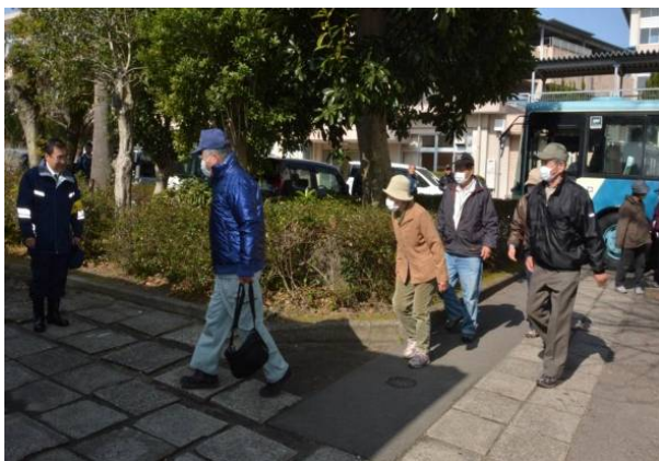
バスによる住民輸送 (平成28年度原子力総合防災訓練)