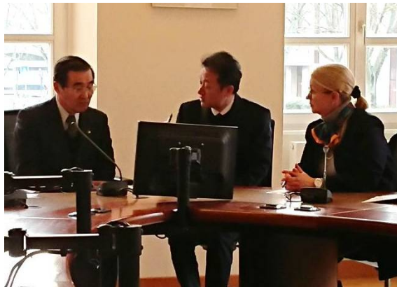
ミュルーズ市長（写真右）との意見交換の様子