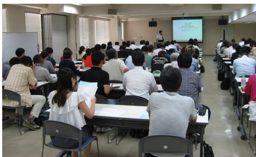
起業セミナーの様子（創業スキル養成講座基礎編）