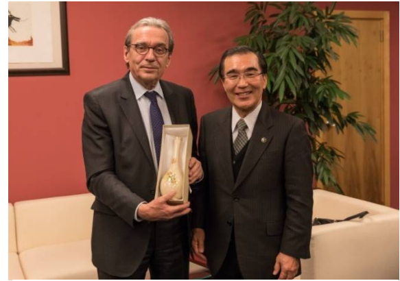
ストラスブール市長へ薩摩焼を贈呈

■ 問い合わせ 産業支援課 099-216-1323 国際交流課 099-216-1131