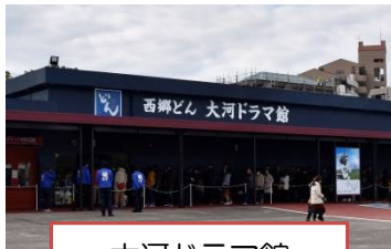
大河ドラマ館 通常 大人 600 円