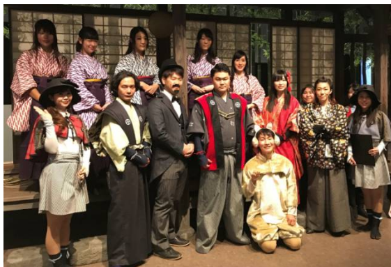
まちなかおもてなし隊