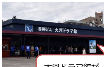
大河ドラマ館が 大人 600 円→480 円に割引