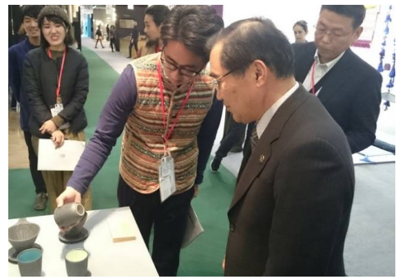
国際見本市「メゾン・エ・オブジェ」視察