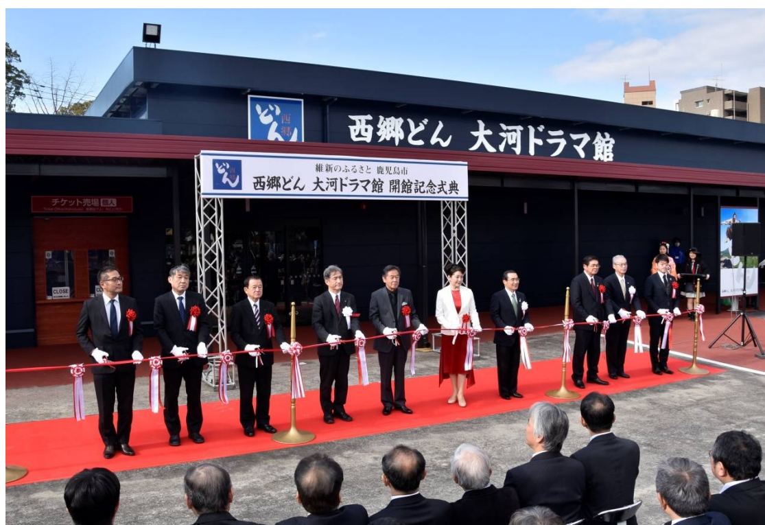
「西郷どん 大河ドラマ館」開館記念式典 (1月13日)