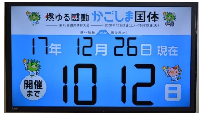
カウントダウンの表示