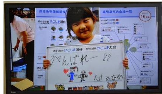
デジタルサイネージの画面の例