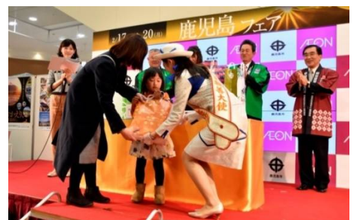
鹿児島フェアの様子