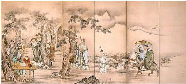
狩野芳崖 『群老雅遊の図』