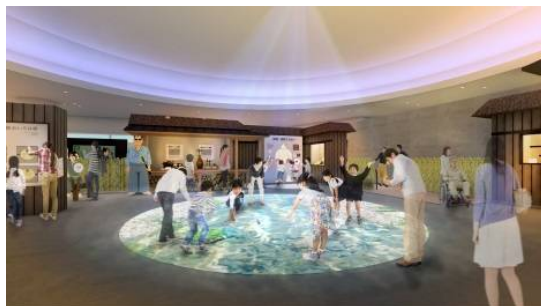
体験しやっもんせ「郷中教育」