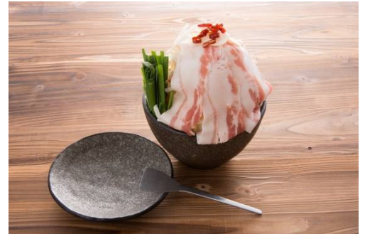
「月島もんじゃ もへじ」の一品 （黒豚辛味噌もんじゃ）