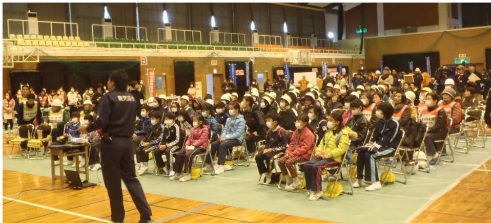
平成28年度 桜島火山爆発総合防災訓練での住民主体の避難所運営訓練