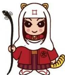
出世法師 直虎ちゃん

大河ドラマ初回放送日に、新旧大河ドラマゆかりの地を代表するマスコットキャラクターがエール交換などを行います！