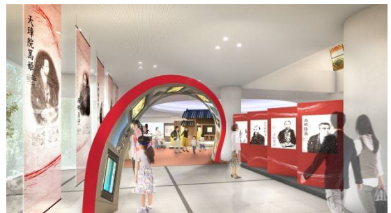
ゆくさ おさいじゃした通り