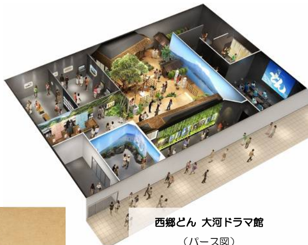
西郷どん 大河ドラマ館 (パース図)