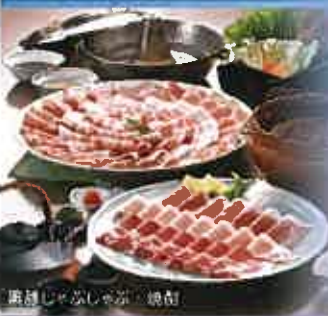
鹿児島の食文化・焼酎