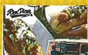
リオンダイナー ホットドッグ