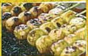
坪水醸造 俺のしんこだんご