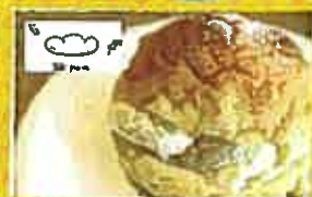
畑 pan メロンパンアイス