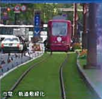
市電・軌道敷緑化