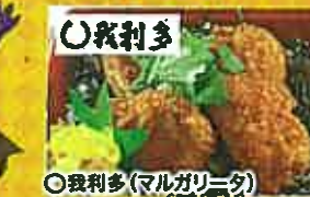
〇我利多 舞桜豚のヒレ肉の タレカツ重