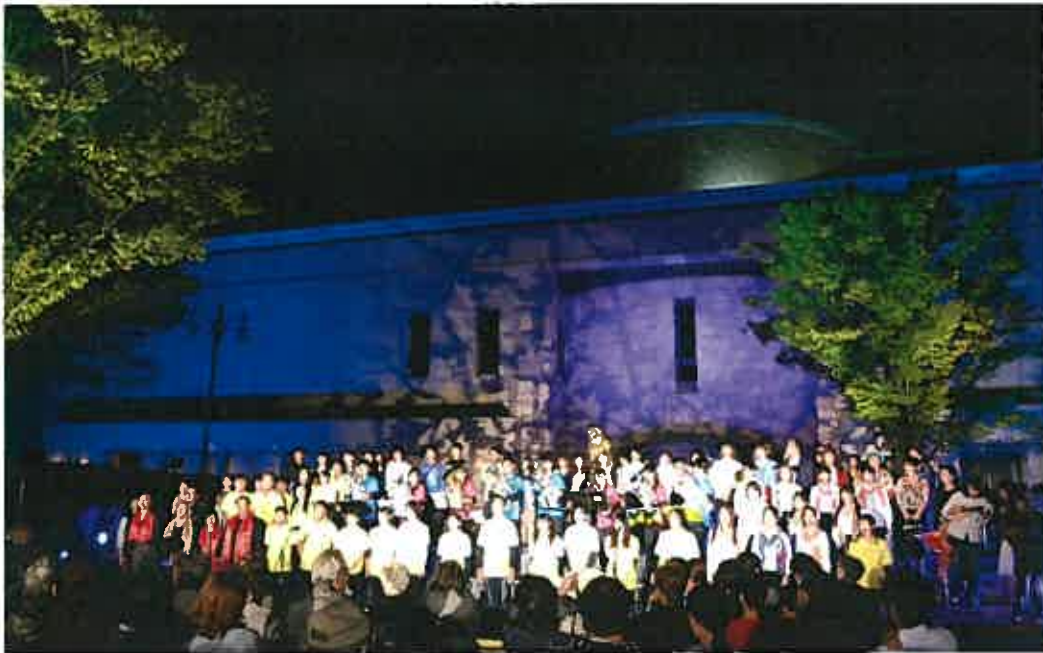
音とあかりの散歩道