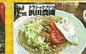
舞田農園 ガレットサンド