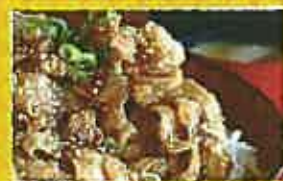
かのやばら肉・ローズダイナー かのや豚バラ丼

鹿屋港に上陸! 地元のグルメや 特産品などがいっぱい!! ランチは大隅グルメを楽しもう。