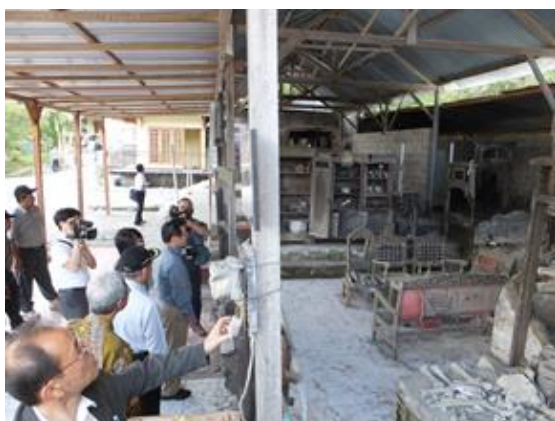
被災地視察の様子