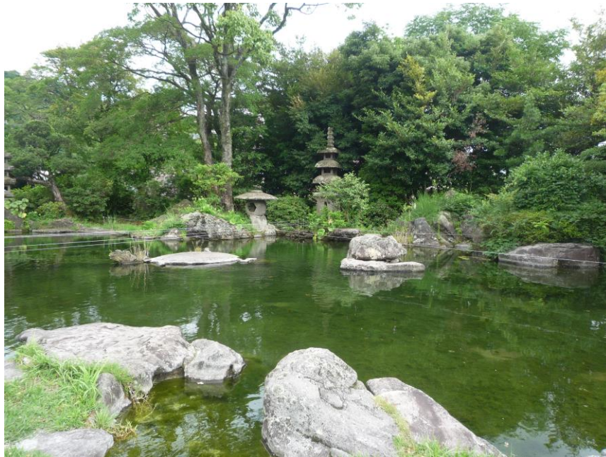
玉里邸庭園 上御庭