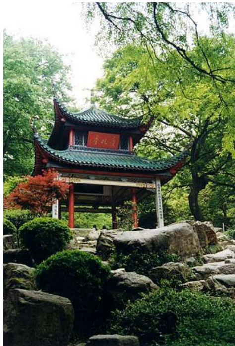
天保山公園内「共月亭」のモデルとなった「愛晩亭」