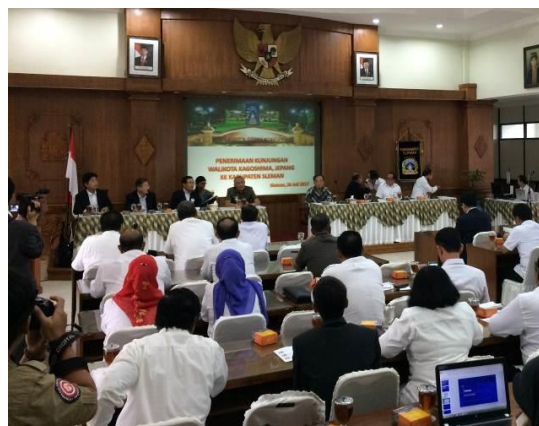
スレマン県と防災意見交換の様子