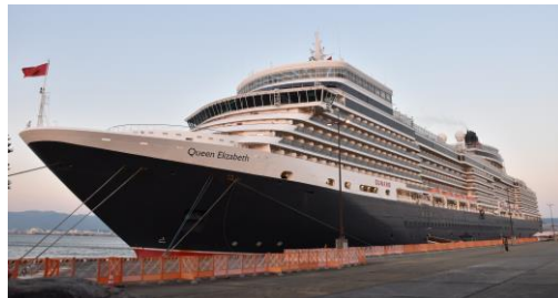
クルーズ船(クイーンエリザベス号)