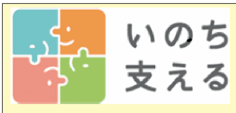
(厚労省) いのち支えるロゴマーク