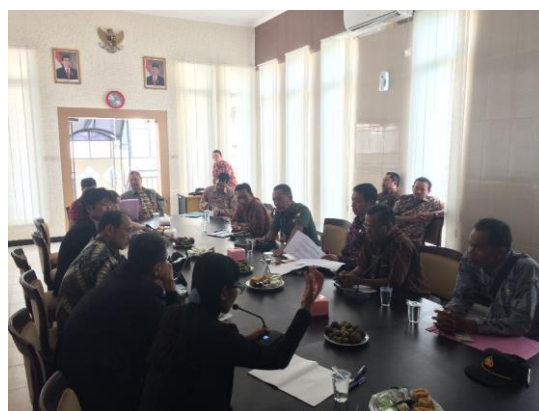
クディリ県と防災意見交換の様子