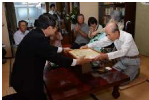
昨年の敬老訪問の様子