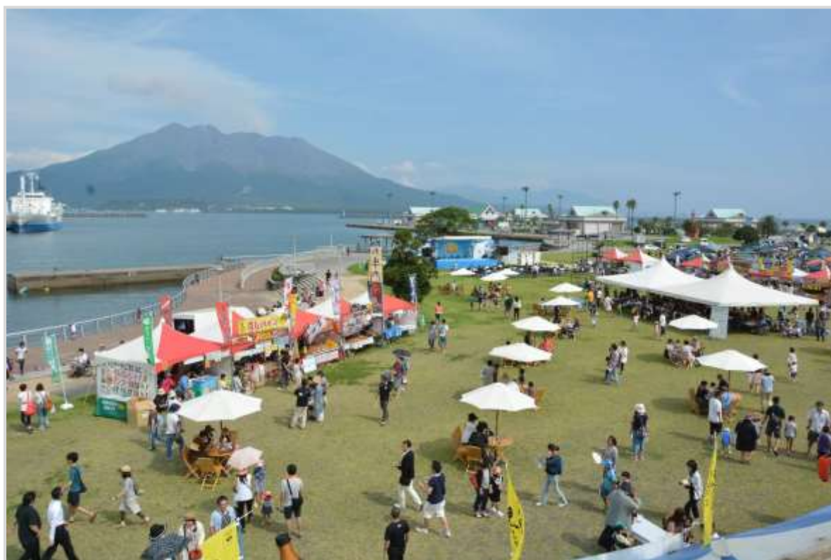
昨年の第1回錦江湾潮風フェスタの様子