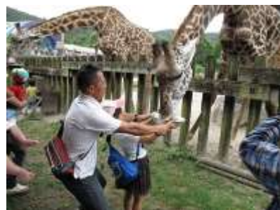
好きな動物にエサをあげよう