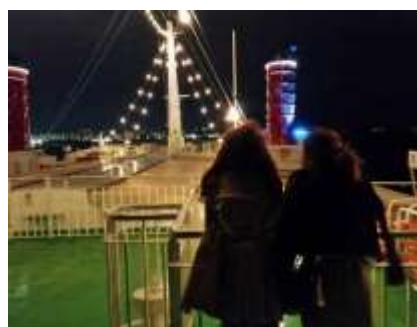
昨年のロングクルーズの様子