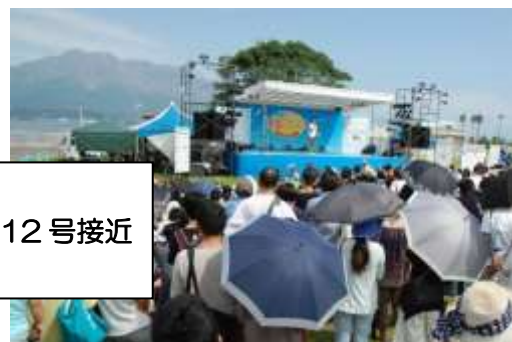
昨年の潮風フェスタの様子