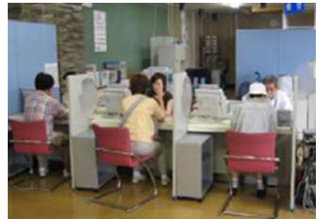
相談風景（イメージ）