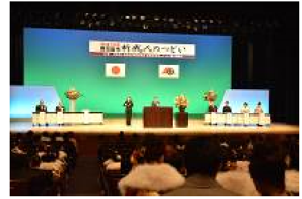
平成28年新成人のつどい