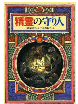
上橋菜穂子『精霊の守り人』 1996年、偕成社