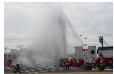
消防隊による一斉放水 (平成28年消防出初式)