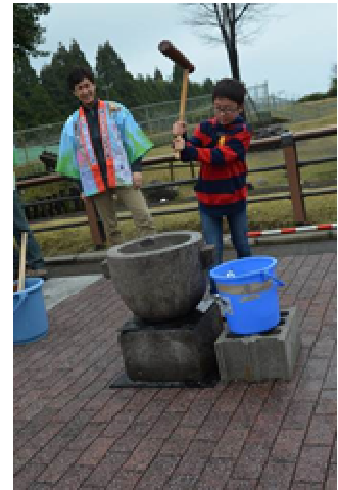
新春親子もちつき大会