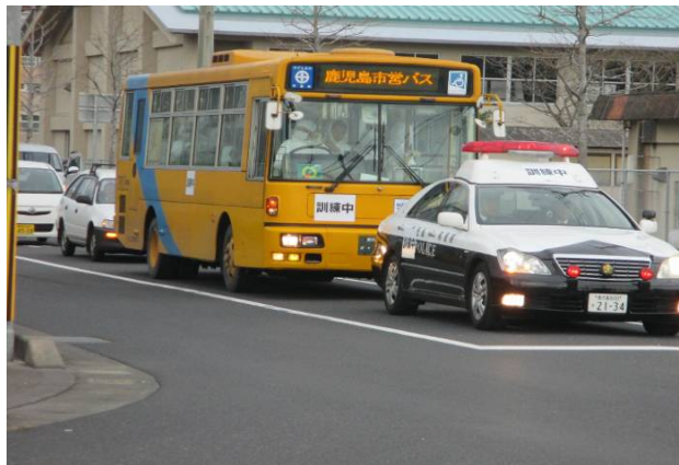
平成27年度の避難誘導訓練の様子