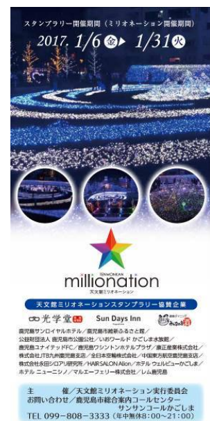
スタンプラリーチラシ