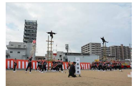
はしご乗り演技 (平成28年消防出初式)