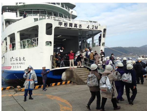
平成27年度の島外避難訓練の様子