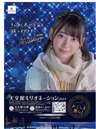
天文館ミリオネーション2017ポスター