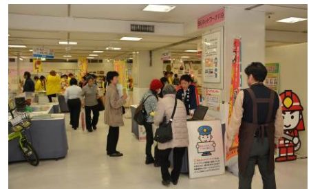
第6回消費生活エキスポ かがしまの様子