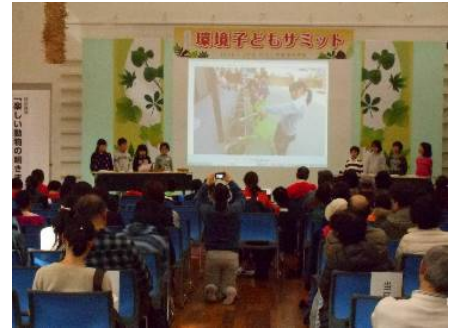
昨年度の環境子どもサミットの様子