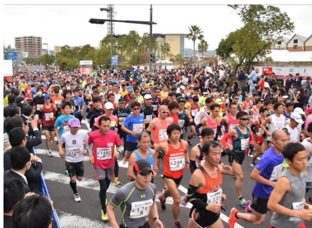
鹿児島マラソン2016の様子