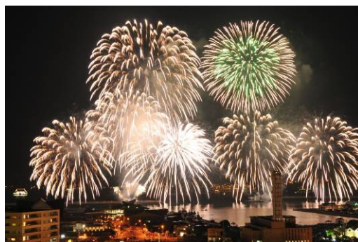
第14回大会の打上げ花火(H26.8)