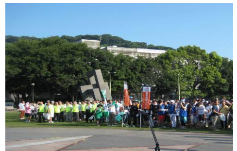
天文館クリーン作戦の様子