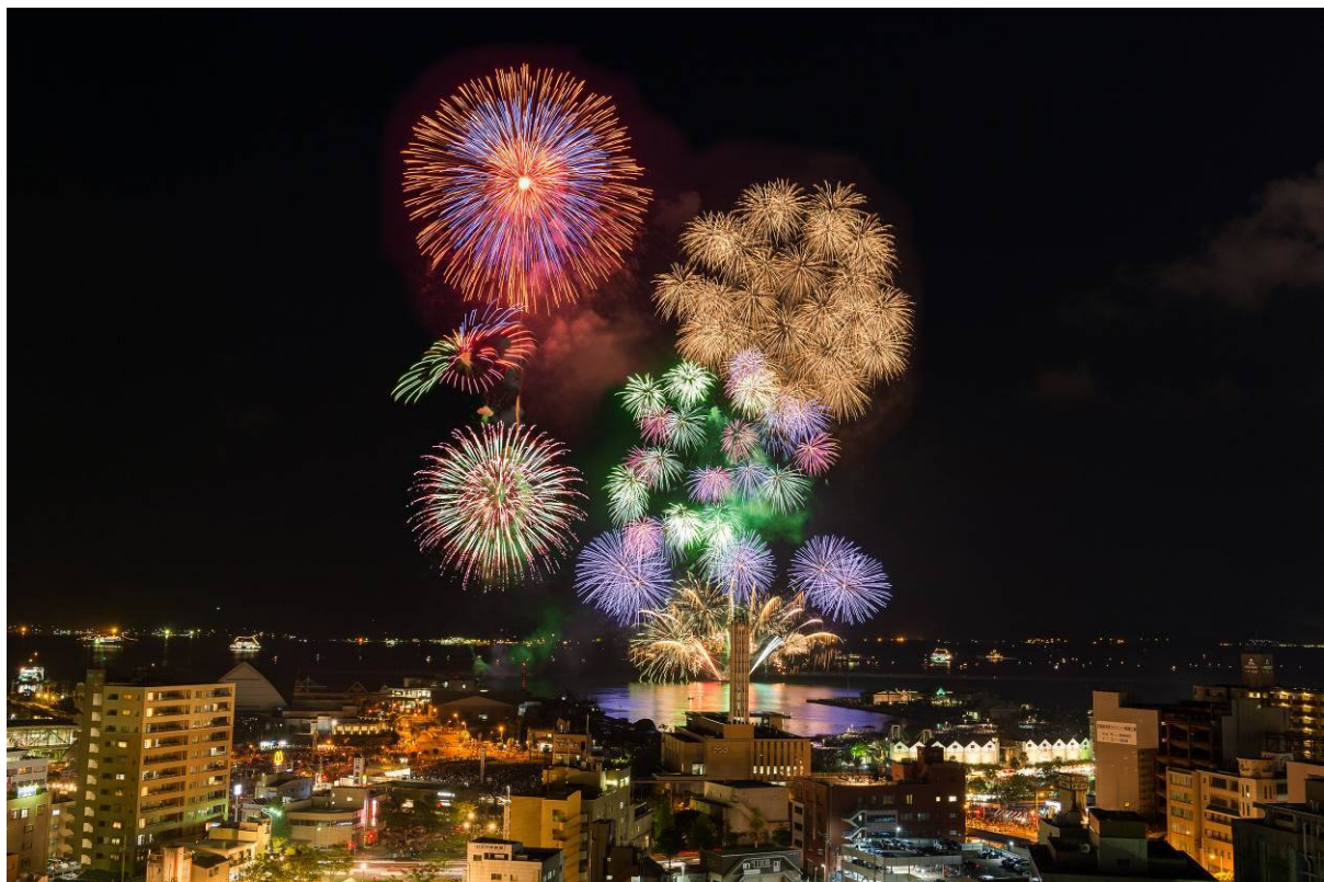
第14回かごしま錦江湾サマーナイト大花火大会