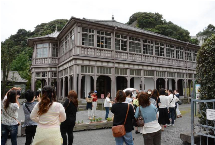
観光客でにぎわう様子(異人館)

平成26年 12万6千人(過去最高) 平成25年 9万6千人 平成24年 7万8千人 平成23年 5万2千人