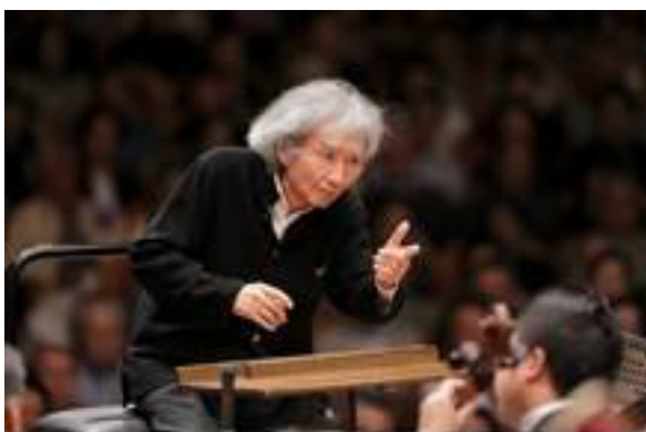
昨年度のコンサートの模様