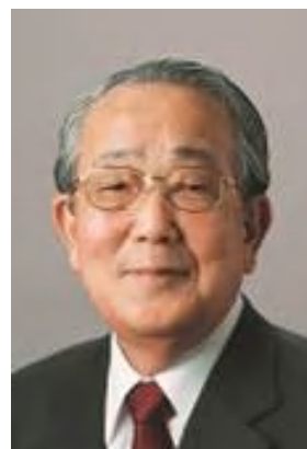
稲盛 和夫 氏

本市（薬師町）生まれ 西田国民学校（現・鹿児島市立西田小学校）、 旧制鹿児島中学校（現・学校法人津曲学園 鹿児島高等学校）、 鹿児島県玉龍高等学校（現・鹿児島玉龍高等学校）を経て、 鹿児島県立大学（現・鹿児島大学）工学部を卒業 その後、松風工業株式会社に入社後、 京都セラミック株式会社（現・京セラ株式会社）を設立 また、財団法人 稲盛財団（現・公益財団法人 稲盛財団）、 第二電電企画株式会社（現・KDDI株式会社）も設立 さらに、株式会社 日本航空（現・日本航空株式会社）会長に就任