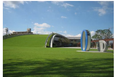
開催場所の環境未来館芝生広場