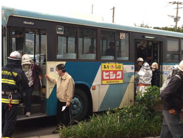
平成26年度の避難訓練の様子 (消防による避難誘導)