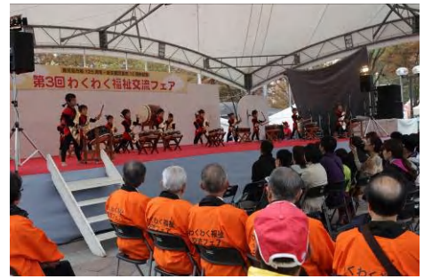
メインステージ（オープニング）の様子