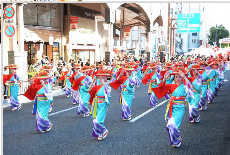
昨年の第63回おはら祭