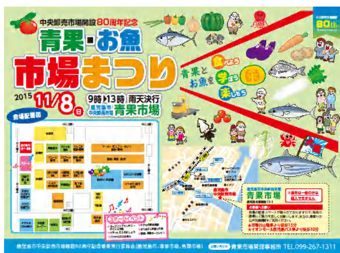
青果・お魚市場まつりポスター