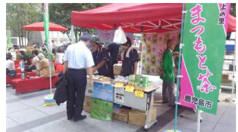
まつもとのお茶の試飲販売