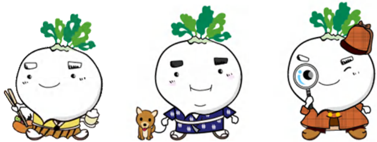
鹿児島市食育推進キャラクター でこん丸