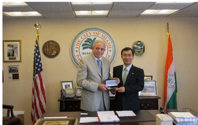
マイアミ市長表敬訪問 (平成23年11月マイアミ市役所にて)