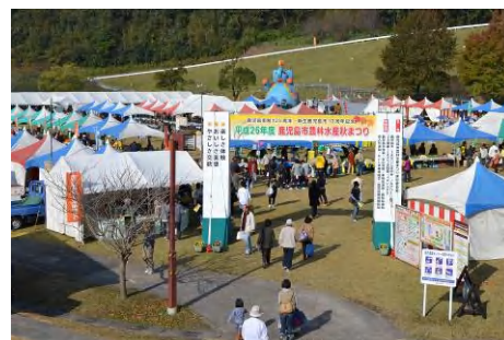
昨年の農林水産秋まつり