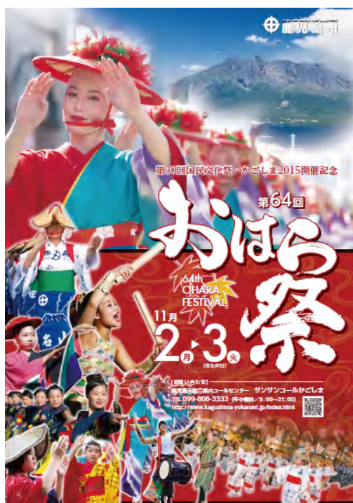
64回おはら祭ポスター