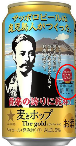
商品ラベルデザイン