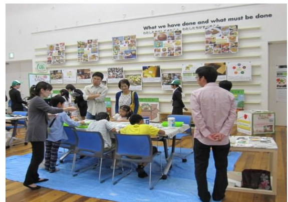
昨年の月間企画展の様子