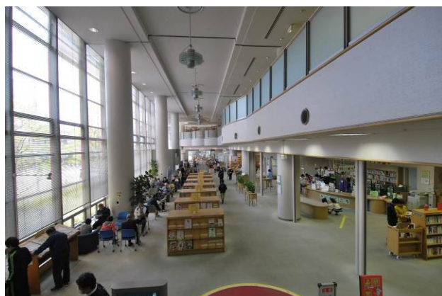
ブラウジング（閲覧）コーナー