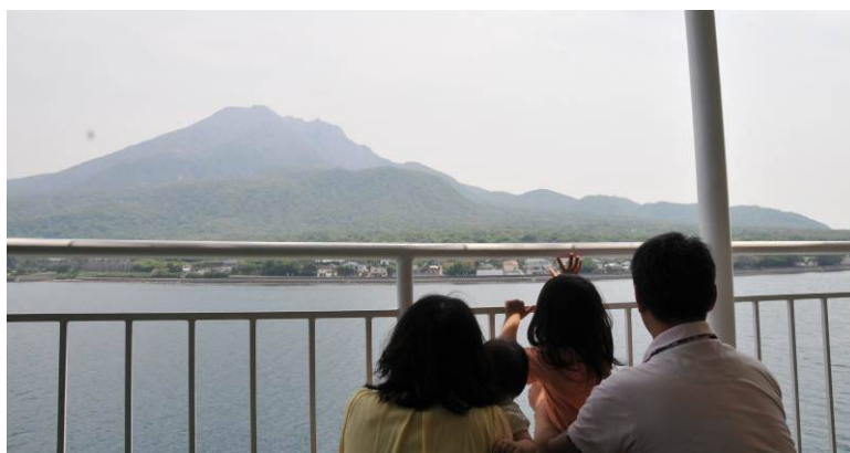
錦江湾魅力再発見クルーズ2014 (5月10日)