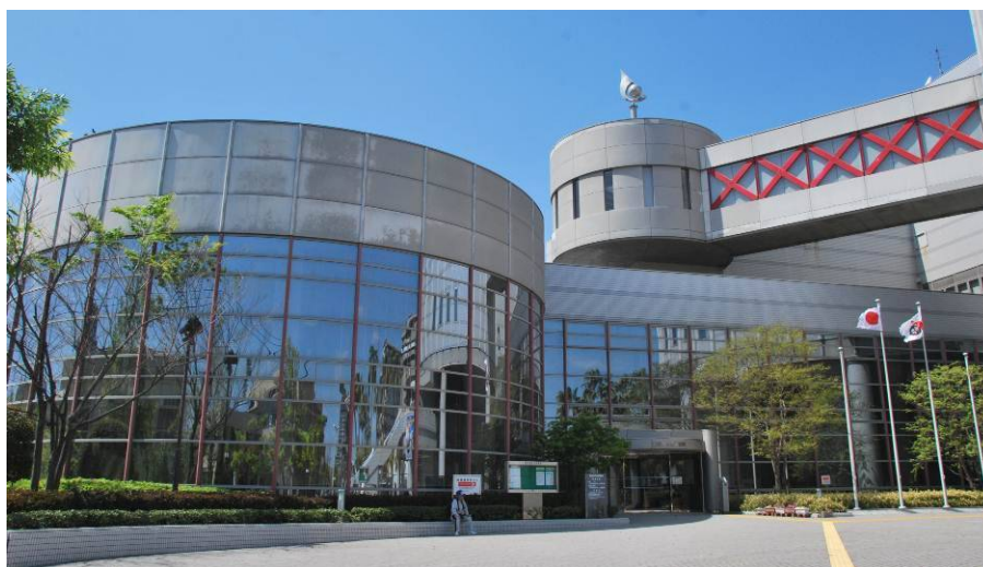
市立図書館の外観