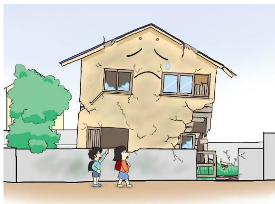
老朽化が著しい危険空き家の例