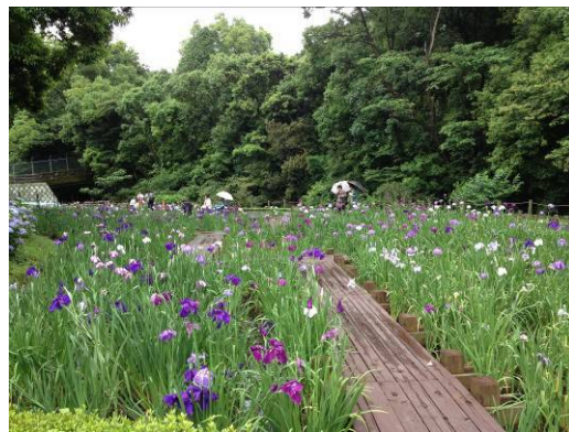
平川動物公園花しょうぶ園