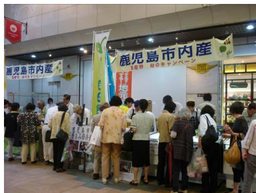
キャンペーンの様子