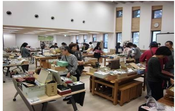
昨年の陶器市の様子

リユース・リサイクルショップのポイント交換 家庭で未使用の日用品や廃食用油などを持ち込んだ市民に対してポイントを付与し、そのポイント数に応じて同ショップ内の品物と交換ができる