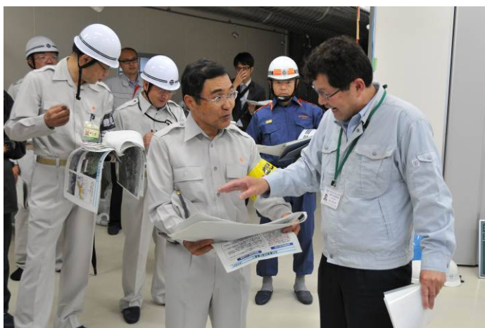
市長による防災点検 (5月12日)