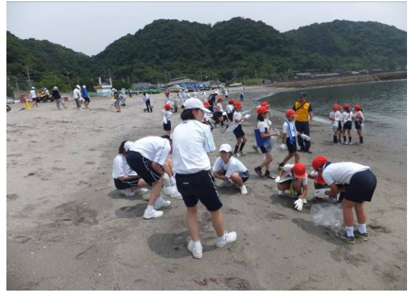
昨年の清掃の様子