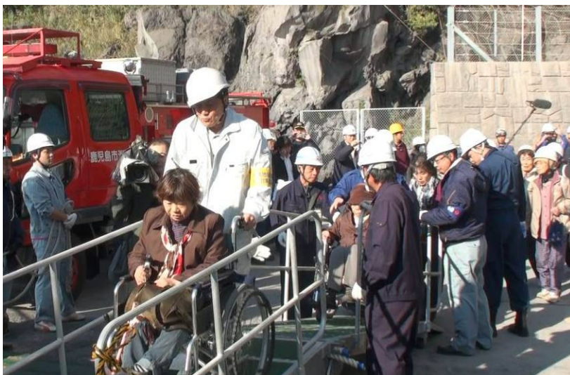
昨年度の避難訓練の様子