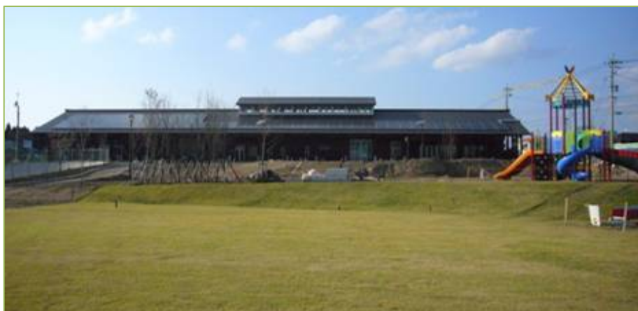
本館 (多目的広場側から)