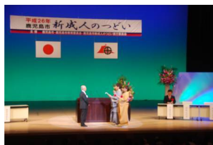
平成26年「新成人のつどい」