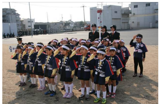
幼年消防クラブ員による 防火のメッセージの発表