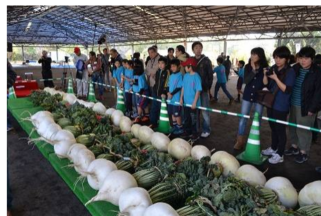
第14回世界一桜島大根コンテストの様子