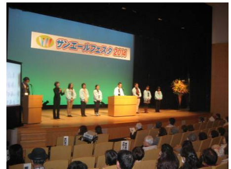
サンエールフェスタ2014の様子