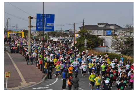
第34回ランニング桜島大会の様子