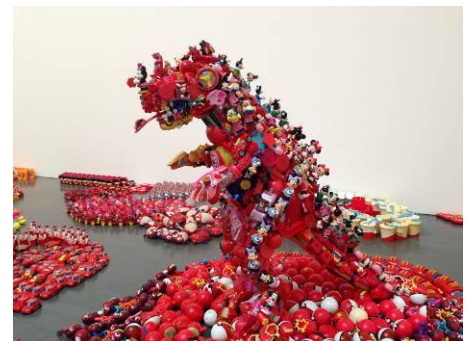
リサイクルアート展示