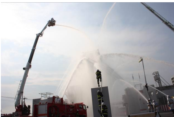
平成26年消防出初式の一斉放水の様子