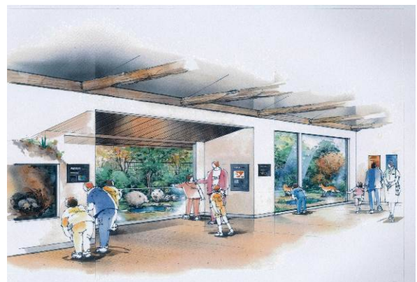
かごしまの動物ゾーン (イメージ図)