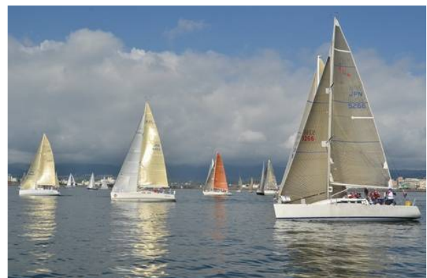
鹿児島カップ火山めぐりヨットレース