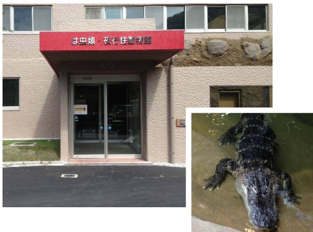
不思議な動物ゾーンの は虫類・夜行性動物館 とミシシッピーワニ