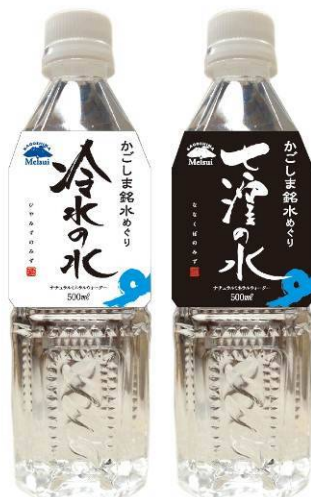
左：冷水の水 右：七窪の水

今でもミネラルを含んだおいしい天然水が1日に約1万m 3 も湧き出ており、本市の重要な水源として使用している。