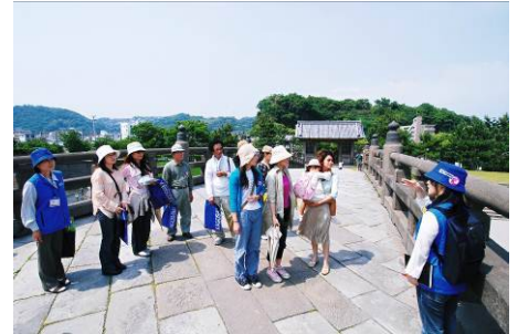
鹿児島ぶらりまち歩き