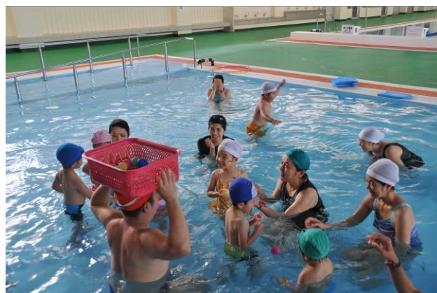
親子ふれあい水泳教室 (鴨池公園水泳プール)