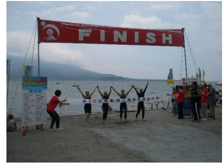
桜島・錦江湾横断遠泳大会