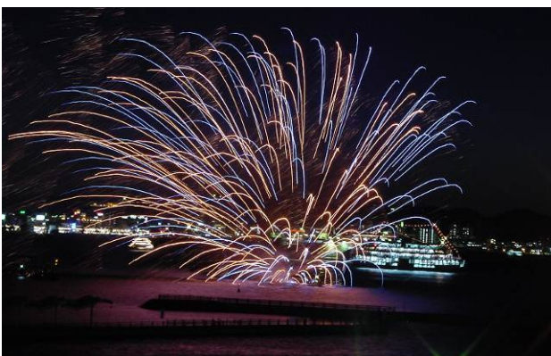
桜島納涼観光船の水中花火