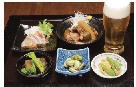
“美味のまち鹿児島” 美味セットの一例