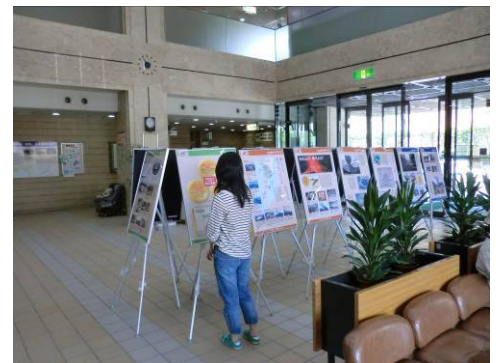
桜島・火山防災学習パネル展