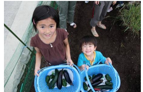
グリーンファーム （夏野菜の収穫体験）