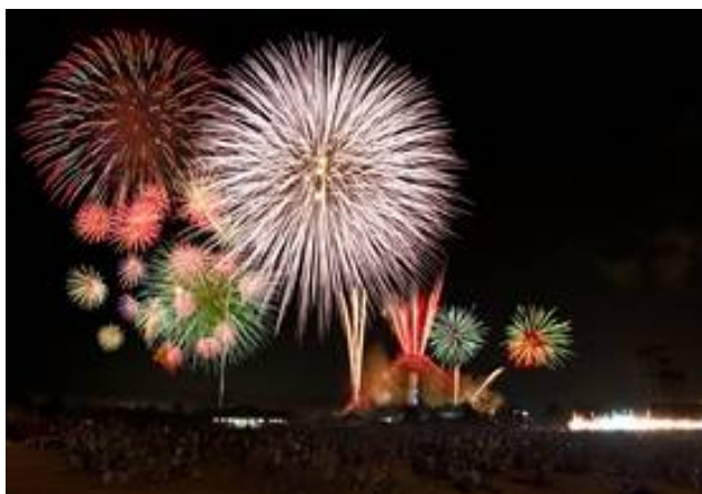
火の島祭り (写真は昨年開催のもの)