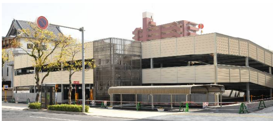
完成した「みなと大通り別館自走式立体駐車場」