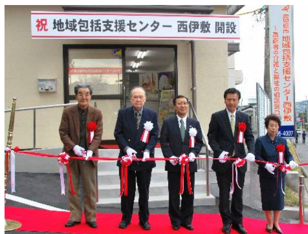
昨年11月に設置された 地域包括支援センター西伊敷