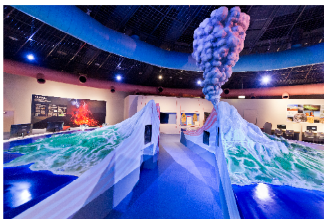
桜島ウォークスルー