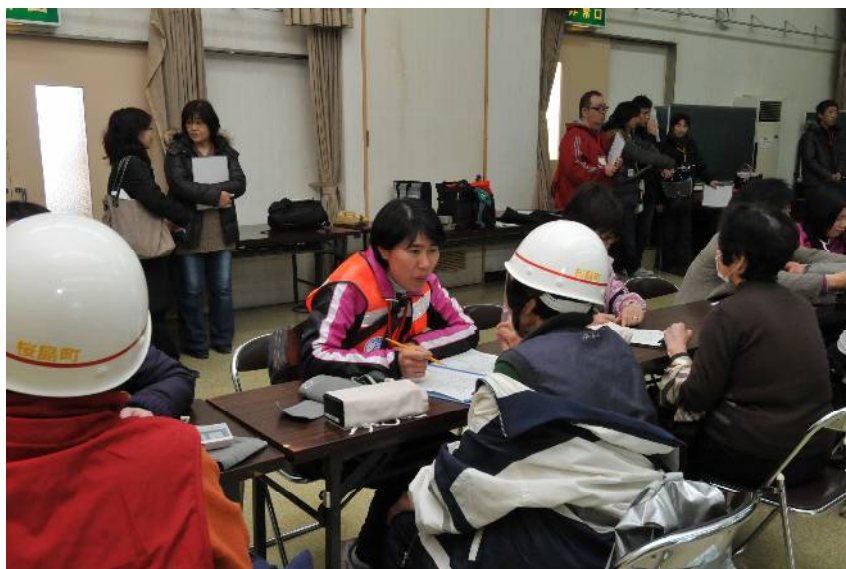
平成24年度桜島火山爆発総合防災訓練で実施された 福祉コミュニティセンター(祇園之洲町)での避難所開設訓練 (平成25年1月11日)