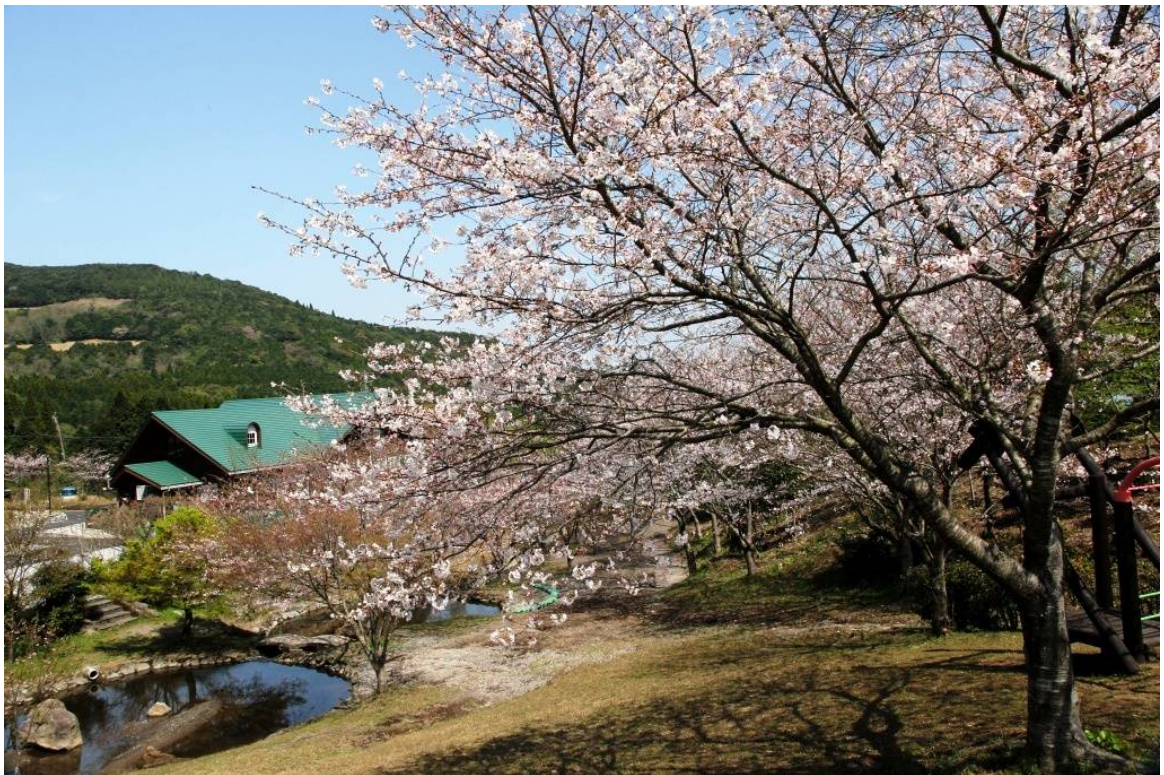
約1000本の桜が楽しめるグリーンファーム(平成25年3月19日撮影)