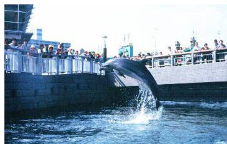
イルカ水路での展示