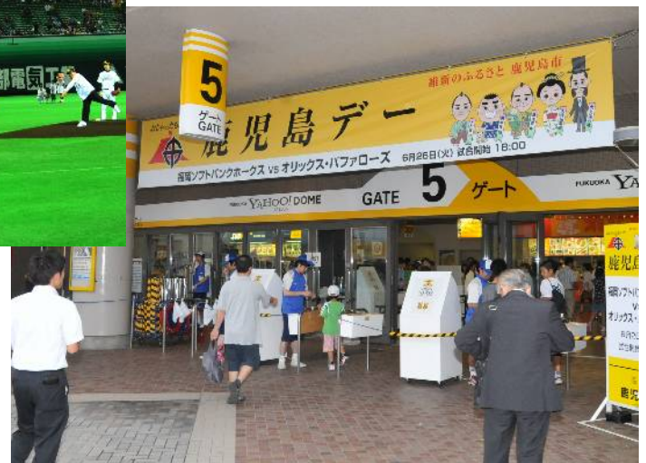
昨年の「鹿児島デー」(平成24年6月26日)