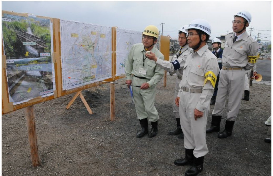
平成23年度防災点検 (木之下川)