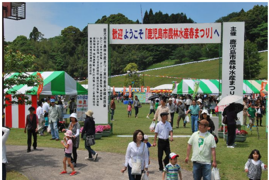
平成23年度鹿児島市農林水産春まつり