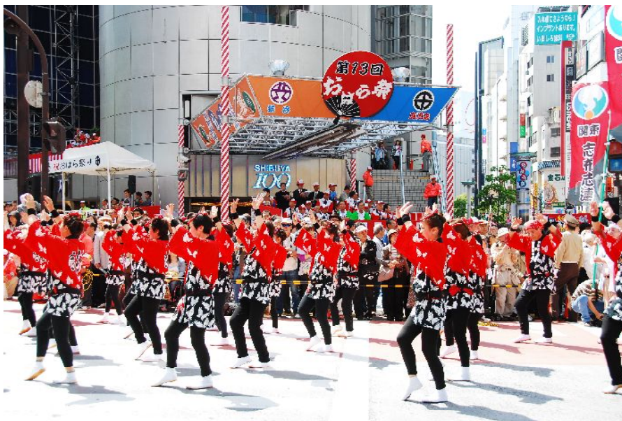
第13回 渋谷・鹿児島おはら祭（踊りパレードの様子）