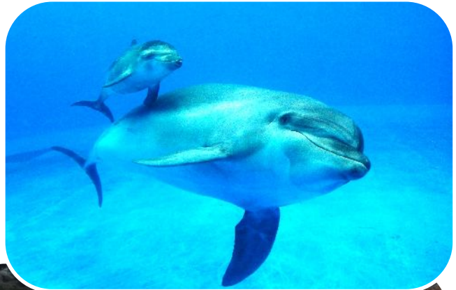
3月5日に生まれた イルカの赤ちゃん