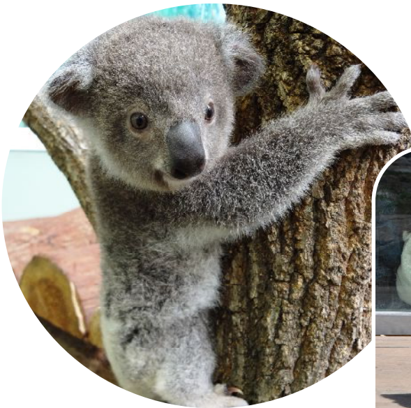
昨年8月4日に生まれたコアラの「ルリア」