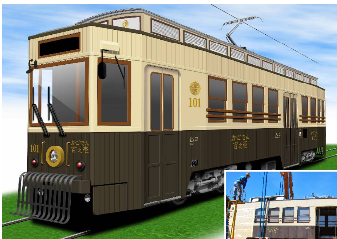
交通局に搬入された観光レトロ電車「かごでん」