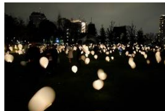
あかりの作品(イメージ)