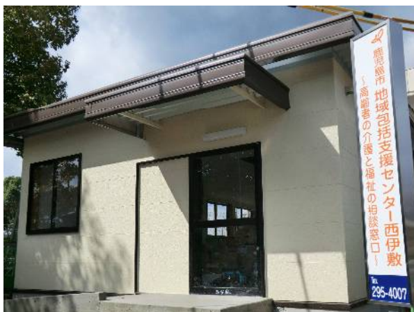
地域包括支援センター西伊敷