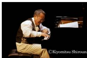
山下 洋輔 氏