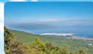
第一展望所からの眺め