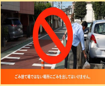
ごみ捨て場ではない場所にごみを出してはいけません。