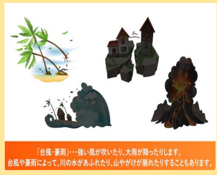
「台風・豪雨」…強い風が吹いたり、大雨が降ったりします。台風や豪雨によって、川の水があふれたり、山やがけが崩れたりすることもあります。