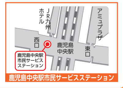
鹿児島中央駅市民サービスステーション