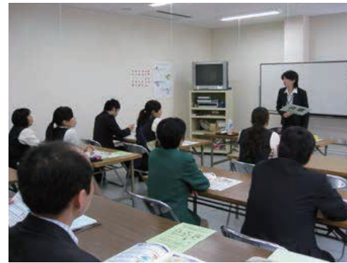
社会人研修の様子