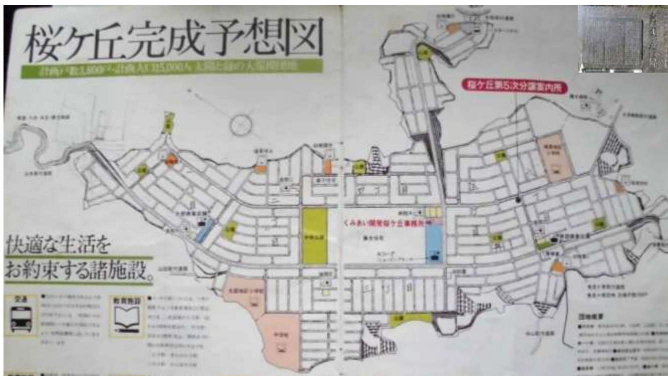
桜ヶ丘団地完成予想図（桜ヶ丘土地分譲パンフレットより）