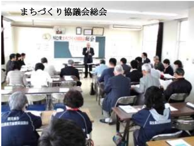
まちづくり協議会総会