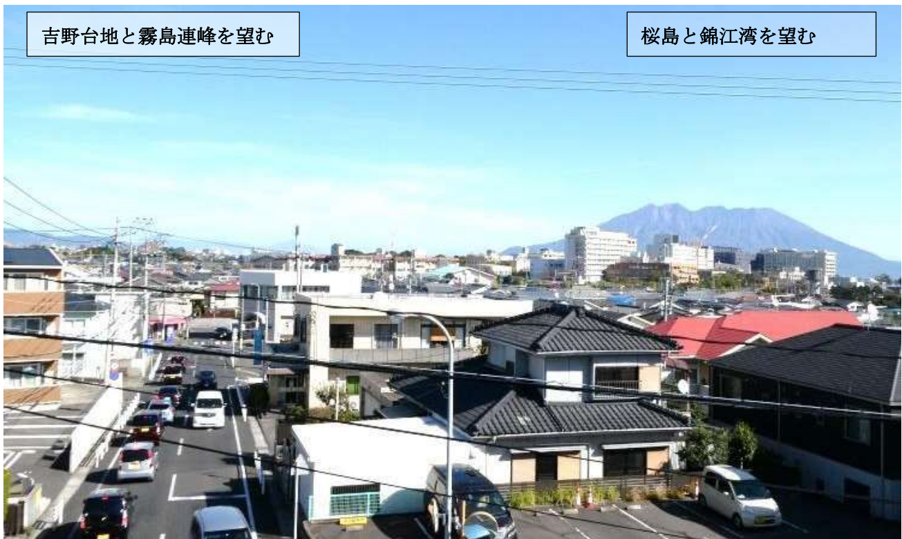
眼前に桜島と錦江湾、遠くに吉野台地、霧島連峰を望む風光明媚な桜ヶ丘団地