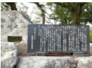
桜ヶ丘中央公園内

八丁目亀ヶ原の北側に、桜ヶ丘ビュータウンが完成し、100戸数余の住宅が建設され、若い人たちが転入して、児童数の増加や団地の活性化に大いに寄与している。