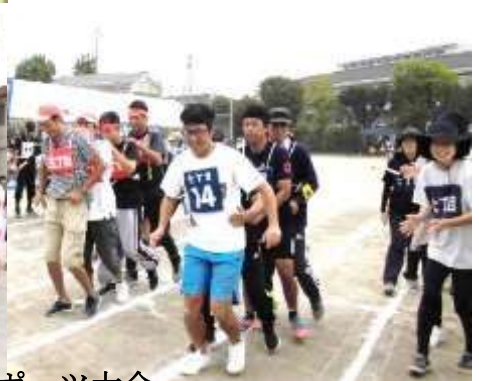
ふれあいスポーツ大会