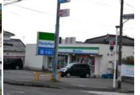
桜ヶ丘交番・桜ヶ丘郵便局・南日本新聞販売所・校区内の公園・商業施設等