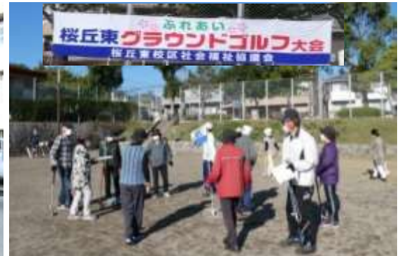
ふれあい 桜丘東グラウンドゴルフ大会 桜丘東校区社会福祉協議会