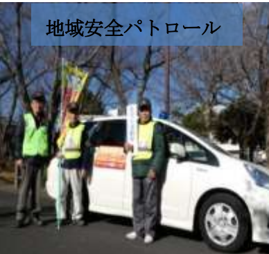
地域安全パトロール