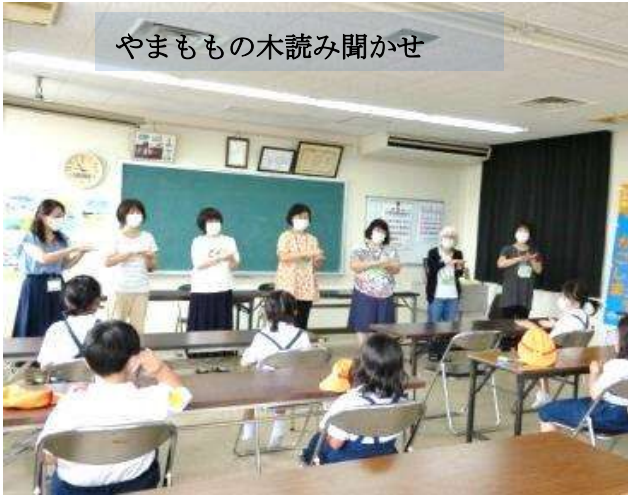
やまものの木読み聞かせ