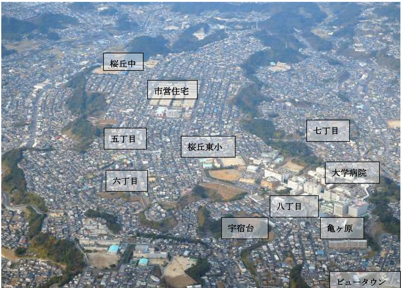
桜丘東校区一手前から亀ヶ原・宇宿台・6・5・7丁目・市営住宅全景