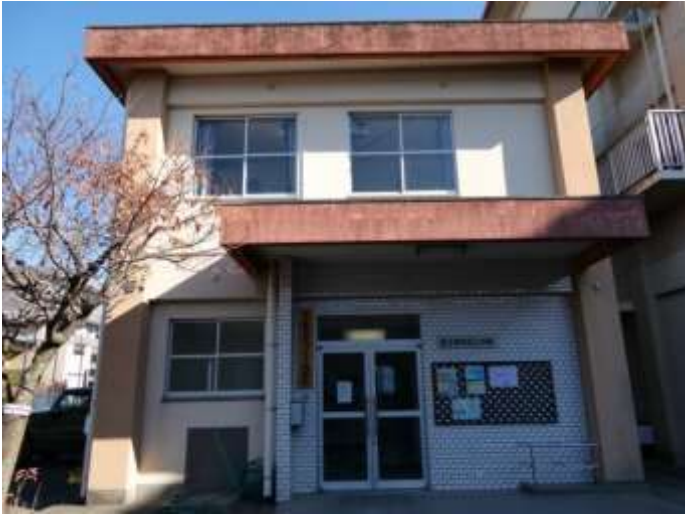
桜丘東校区公民館（桜丘東まちづくり協議会）