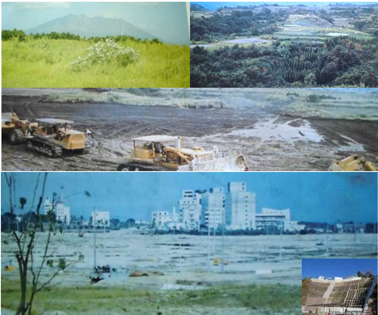
上ノ原台地と開発の様子・現在の周辺防災工事（令和5年）