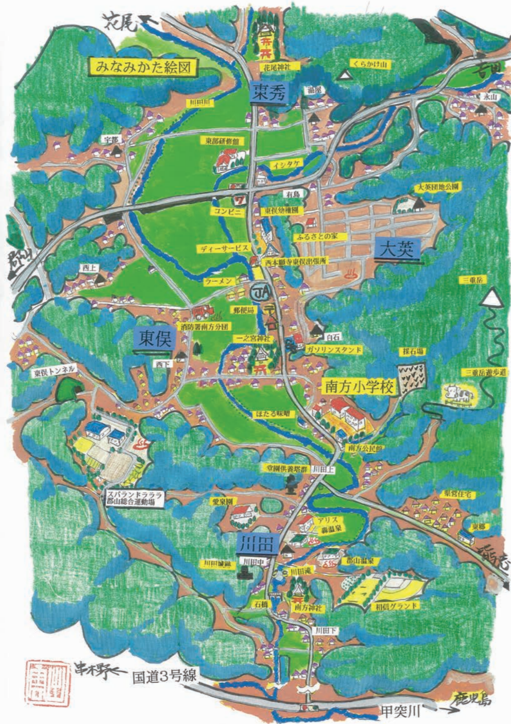
東秀 出雲信明 作